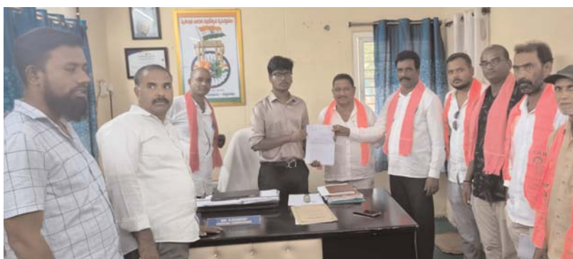
అక్షర కలం భద్రాద్రి కొత్తగూడెం ప్రతినిధి :-