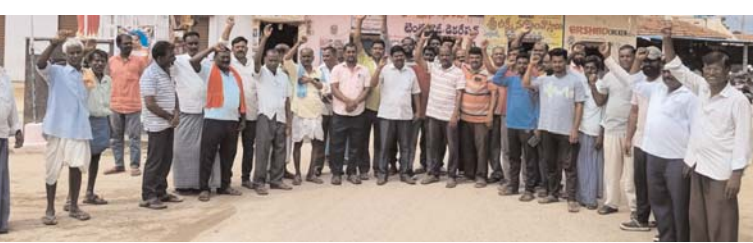
అక్షర కలం రాజన్న సిరిసిల్ల

గంభీరపువేటి మండలం కొత్తపల్లి గ్రామంలో రైతు సంఘం ఆధ్వర్యంలో రైతులు నిరసన చేపట్టారు. యూరియా ఎరువును యాప్ ద్వారా కాకుండా నేరుగా రైతులకు అందించాలని డిమాండ్ చేశారు. యాప్ విధానం కారణంగా చాలా మంది రైతులు ఇబ్బందులు ఎదుర్కొంటున్నారని, సాంకేతిక సమస్యలతో ఎరువులు సకాలంలో అందడం లేదని ఆవేదన వ్యక్తం చేశారు. వ్యవసాయ పనులు కీలక దశలో ఉన్న సమయంలో యూరియా అందక పంటలు దెబ్బతింటాయని రైతులు తెలిపారు. ప్రభుత్వం వెంటనే స్పందించి యాప్ విధానాన్ని పక్కన పెట్టి, పాత విధానంలోనే నేరుగా యూరియా పంపిణీ చేపట్టాలని రైతు సంఘం నాయకులు డిమాండ్ చేశారు. రైతులకు ఎలాంటి ఇబ్బందులు లేకుండా తగినంత యూరియా నిల్వలు అందుబాటులో ఉంచాలని అధికారులను కోరారు.