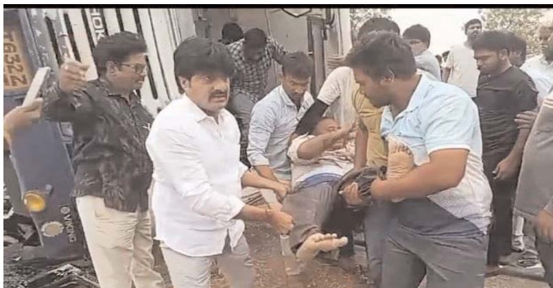
గద్వాల జిల్లా అక్షర కలం ప్రతినిధి

అర్టీసీ బస్సు బోల్తా ఎమ్మెల్యే విజయకు చొరవతో ప్రమాదంలో గాయపడిన ప్రయాణికులను ఆసుపత్రికి తరలింపు,