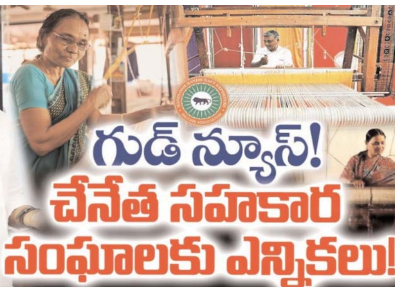
అక్షర కలం, చౌటుప్పల్

చేనేత సహకార సంఘం ఎన్నికల నోటిఫికేషన్ విడుదల