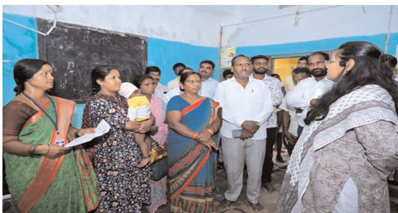
మెడక్/కొల్వారం జూన్ 25(అక్షర కలం):-

అంగన్నాడిలోని విద్యార్థులకు పాష్టికాహారం అందించాలని జిల్లా కలెక్టర్ అధికారులకు సూచించారు.గురువారం కంది మండలంలోని అచ్చంపేట్ అంగన్నాడి కేంద్రాన్ని ఆర్టీవో తాహసీల్దార్ తో కలిసి జిల్లా కలెక్టర్ పరిశీలించారు. ఈ సందర్భంగా జిల్లా కలెక్టర్ మాట్లాడుతూ అంగన్నాడి విద్యార్థులకు ప్రభుత్వ మేసా ప్రకారం బలవర్ధకమైన సంపూర్ణ పాష్టికాహారాన్ని అందించాలన్నారు.అంగన్నాడిలో పరిసరాలు పరిశుభ్రంగా ఉండాలన్నారు. తక్కువ బరువు, ఎత్తు తక్కువ ఉన్న పిల్లలపై ప్రత్యేక శ్రద్ధవహించాలన్నారు. ఈ కార్యక్రమంలో అంగన్నాడి సిబ్బంది తదితరులు పాల్గొన్నారు.