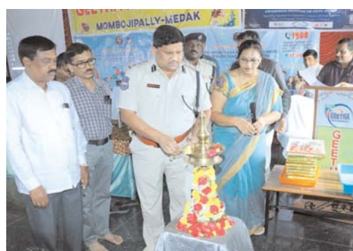
మెడక్ /కొల్వారం జూన్ 25(అక్షర కలం):-

జిల్లా పోలీసు శాఖ ఆధ్వర్యంలో డ్రగ్స్ అవగాహన కార్యక్రమం నిర్వహించారు.ఈ సందర్భంగా ఎస్పీ మాట్లాడుతూ విద్యార్థి దశలో తీసుకునే ప్రతి నిర్ణయం భవిష్యత్తును నిర్దేశిస్తుందని, తాత్కాలిక ఆనందం, చెడు స్నేహాలు, ఆసక్తి కోసం మత్తు