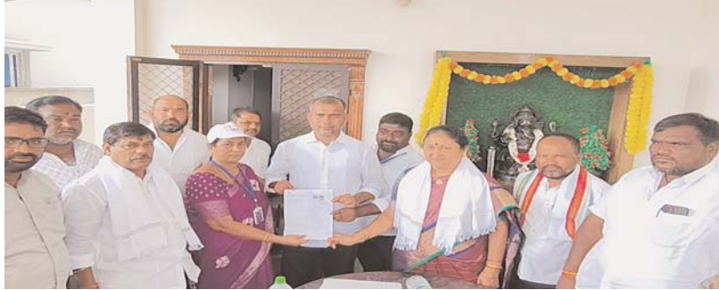
సంగారెడ్డి ప్రతినిధి, అక్షరకలం..

కంది మండలం ఏడుమైలారం లో సర్ ప్రక్రియ ను పరిశీలించిన నిర్మాణ జగ్గారెడ్డి