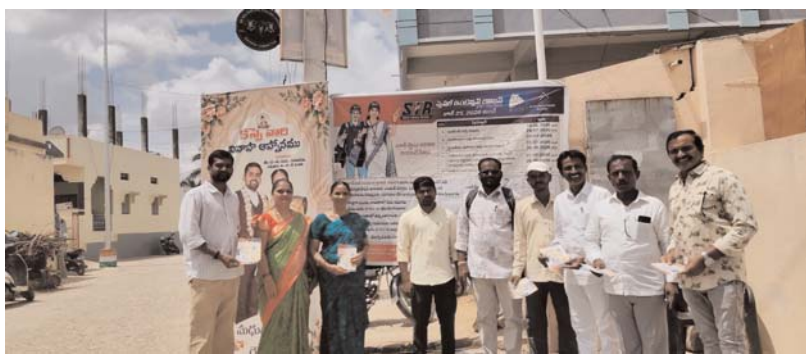
(అక్షర కలం, నారాయణపేట జిల్లా రిపోర్టర్, జూన్,25)

మరికల్ మండల కేంద్రంలో గురువారం ఓటరు జాబితా సమగ్ర సవరణ ప్రక్రియలో తప్పిల్లు లేని ఓటరు జాబితాను రూపొందించేందుకు అధికారులు చైతన్య పరిక్ష్క విధంగా సంబంధించిన పాంప్లెట్ ప్రదర్శిస్తూ, ఓటర్ లో చైతన్యం, పరిజ్ఞానం పెంచేందుకు నిరాధారాలు చేస్తూ ఉత్సాహంగా కార్యక్రమం నిర్వహించారు.కేంద్ర ఎన్నికల సంఘం ఎంతో ప్రతిష్టాత్మకంగా నిర్వహిస్తున్న ఎన్ఐఆర్ ను విజయవంతం చేసేందుకు ప్రతి ఒక్కరు సహకరించాలన్నారు. మరణించిన వారి, అనర్హుల ఓటరు తొలగించి ఓటరు జాబితాను పారదర్శకంగా రూపొందించేందుకు ఎన్ఐఆర్ ప్రక్రియ దోహదపడుతుందన్నారు. ఈ కార్యక్రమంలో బిఎల్ఎ, బిఎల్ఓ, లు, సూపర్వైజర్లు తదితరులు పాల్గొన్నారు.