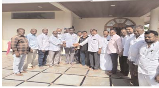
గద్వాల, అక్షర కలం ప్రతినిధి

జోగులాంబ గద్వాల జిల్లా కేంద్రంలోని నల్లకుంటలో ఉన్న స్వశాన వాటిక స్థలాన్ని కొందరు వ్యక్తులు కట్టా చేస్తున్నారని, ఆ స్థలాన్ని పరిరక్షించేందుకు తక్షణ చర్యలు తీసుకోవాలని