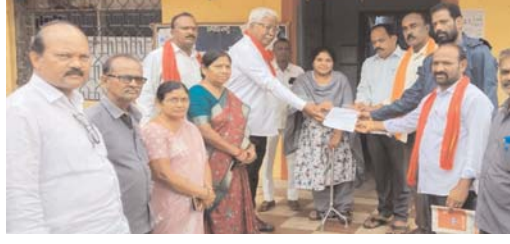
పెరగడం వలన ప్రభుత్వం ఎరువులు విత్తనాల రేట్లు పెంచినందున అన్నాను. వెంటనే విత్తనాలు విత్తనాలు ఎరువుల ధరలు తగ్గించాలని, రాష్ట్ర ప్రభుత్వం ప్రకటించిన పంట రుణ పథకాన్ని పక్కనపెట్టి అమలు చేయాలని అలాగే రైతు పండించినటువంటి పంటలను రాష్ట్ర ప్రభుత్వం కొనుగోలు చేయాలని పేర్కొన్నారు. రెండు లక్షల పంట రుణాలను మాఫీ చేసి, రైతులకు కొత్త రుణాలు అందించాలని, మార్కెట్లో నకిలీ విత్తనాలు అమ్ముతున్న పురుగు మందు ప్రైవేటు వ్యాపారస్తులపై ప్రభుత్వం పీడియాక్ట్ పట్టి చట్టపరమైన చర్యలు చేపట్టాలని,