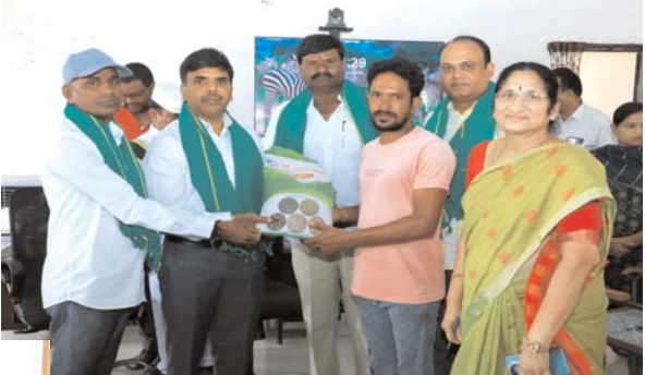
ఉమ్మడి సర్కిల్ బ్యారో అక్షరకలం

కనగల్లో విత్తనమేళా ప్రారంభం ఆరుతడి, ప్రత్యామ్నాయ పంటలపై దృష్టి పెట్టాలని రైతులకు సూచన