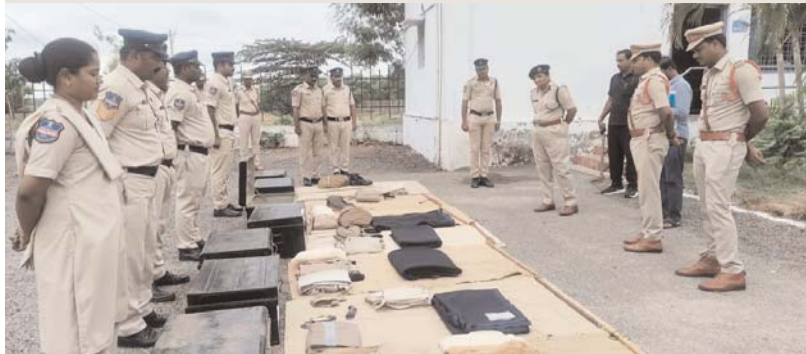
మహబూబ్ నగర్, జూన్ 23. అక్షర కలం :