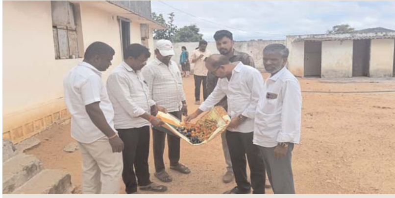
గండ్లపేట, జూన్ 23. అక్షర కలం :

విద్యార్థుల ఆరోగ్యంతో చెలాటం.. అధికారుల ఆగ్రహం ఉపాధ్యాయులకు తీవ్ర హెచ్చరిక.. మరోసారి పునరావృతమైతే కఠిన చర్యలు