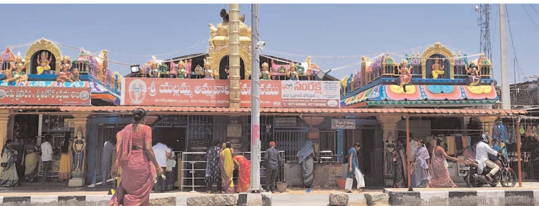
25న బోలెడు కోలాహలం.. శతఘంటాభిషేకం..

ఆధ్యాత్మికత వెలివేసిన వేళ. భక్తజన హృదయాలు పులకించే అద్భుత ఘట్టానికి ముహూర్తం కుదిరింది. సర్కారు సుందరంగా ముస్తాబైన రేణుక ఎల్లమ్మ అమ్మవారి క్షేత్రం వార్షిక బ్రహ్మోత్సవాలకు సిద్దమైంది. ఈ నెల 23వ తేదీ నుండి 25వ