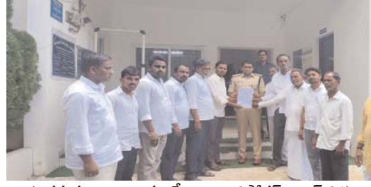
(అక్షర కలం, నారాయణపేట జిల్లా రిపోర్టర్, జూన్ 21)