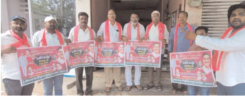
అక్షర కలం / భద్రాద్రి కొత్తగూడెం జిల్లా ప్రతినిధి :-