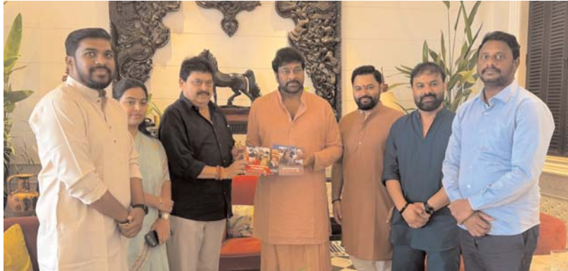
హైదరాబాద్, అక్షరకలం ప్రతినిధి