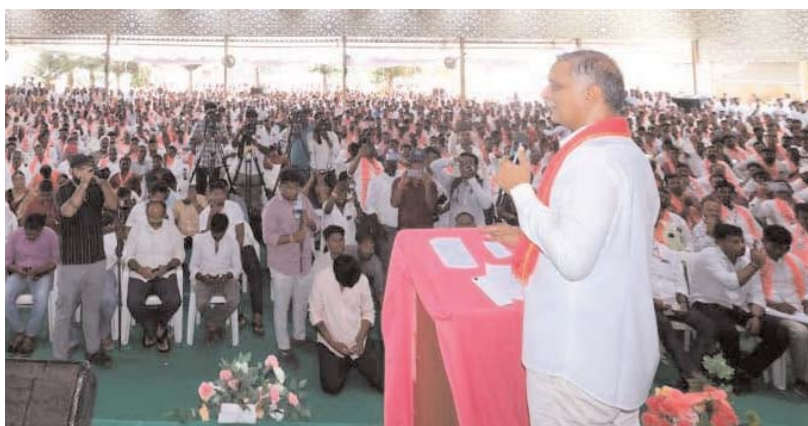
మహబూబ్ నగర్, అక్షరకలం ప్రతినిధి