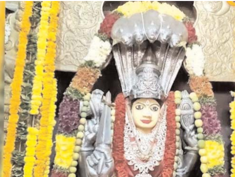
ఉమ్మడి సల్లగొండ బ్యారో అక్షరకలం

ఆధ్యాత్మికత వెలివేసిన వేళ. భక్తజన హృదయాలు పులకించే అద్భుత ఘట్టానికి ముహూర్తం కుదిరింది. సర్కారు సుందరంగా ముస్తాబైన రేణుక ఎల్లమ్మ అమ్మవారి క్షేత్రం వార్షిక బ్రహ్మోత్సవాలకు సిద్దమైంది. ఈ నెల 23వ తేదీ నుండి 25వ