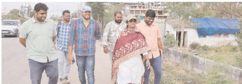
మేడ్చల్, అక్షరకలం ప్రతినిధి: