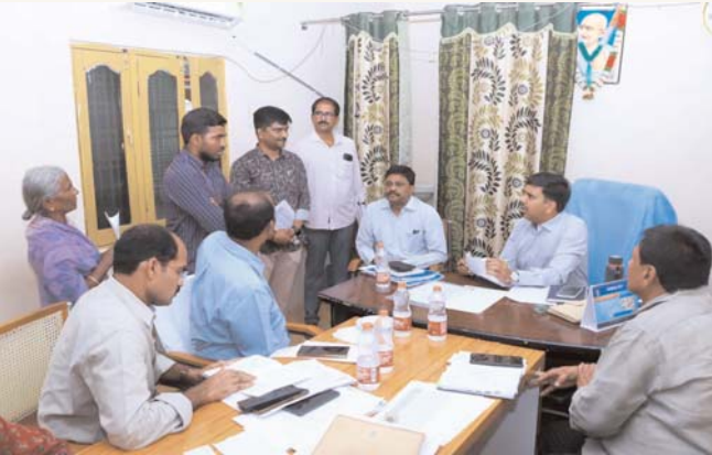
సమస్యలు ఏమైనా ఉంటే వాటిని ఆలస్యం చేయకుండా కలెక్టర్ వెంట ఉన్నారు.