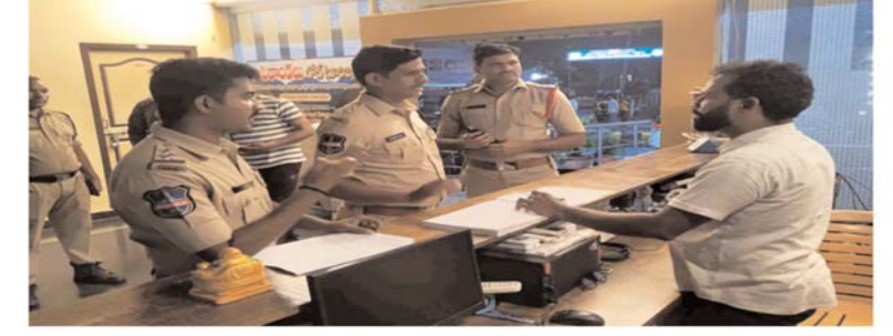
అక్షర కలం / భద్రాచలం