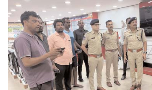
అక్షర కలం/ ఖమ్మం ప్రతినిధి: నగరంలోని ప్రముఖ విక్రయ కేంద్రమైన 'సోని విజన్' షోరూమ్లో ఆర్ధరాత్రి దాడిని తర్వాత చోరీ జరిగింది.

సమాచారం తెలుసుకున్న పోలీస్ కమిషనర్ సునీల్ దత్ ఫుటనా స్థలానికి చేరుకొని వివరాలు తెలుసుకున్నారు. నిందితులను పట్టుకునేలా పోలీస్ అధికారులకు దిశానిర్దేశం చేశారు. గుర్తుతెలియని దుండగులు షాపు తాళాలు పగలగొట్టి లోపలికి చొరబడి, స్టాక్ రూమ్లో భద్రపరిచిన విలువైన ఆధునాతన మొబైల్ ఫోన్లు చోరీ జరిగినట్లు యాజమాన్యం ఇచ్చిన ఫిర్యాదు మేరకు స్థానిక పోలీసులు ఫుటనా స్థలానికి చేరుకుని దర్యాప్తు ప్రారంభించారు. క్లౌడ్ టీమ్ రంగంలోకి దిగి వేలిముద్రలు, ఇతర కీలక ఆధారాలను సేకరిస్తున్నారు. షాపు పరిసర ప్రాంతాలలో ఉన్న సీసీటీవీ ఫుటేజీలను పోలీసులు క్షుణ్ణంగా పరిశీలిస్తున్నారు.