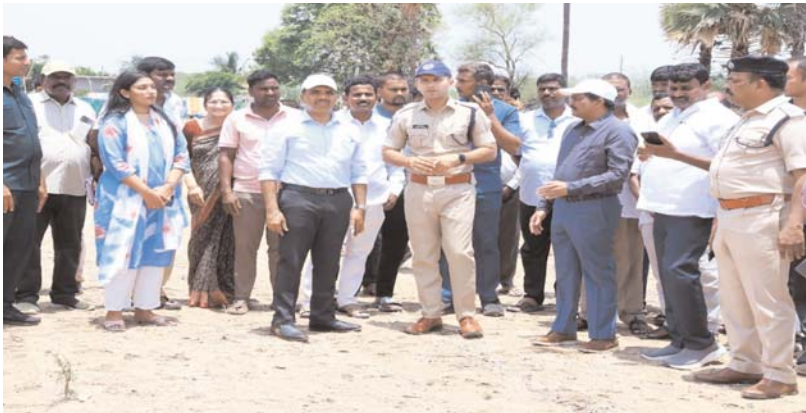
ఉమ్మడి నల్గొండ జ్యూరీ అక్షరకలం