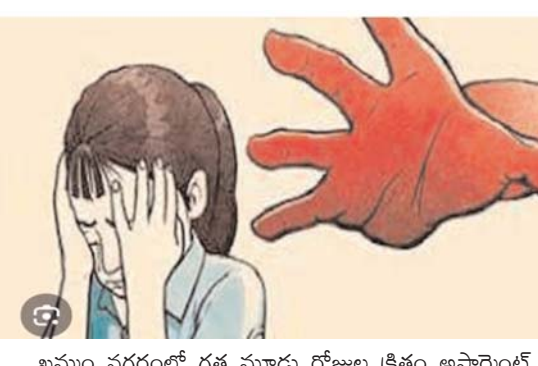
అక్షర కలం/ ఖమ్మం ప్రతినిధి:

ఖమ్మం నగరంలో గత మూడు రోజుల క్రితం అపార్థెంట్ వాచ్మెన్ కుటుంబానికి చెందిన మైనర్ బాలిక పై లారీ డ్రైవర్ గౌస్ అనే దుర్మార్గుడు లైంగిక దాడి చేసి ముడతస్తులపై