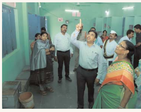
ఉమ్మడి నల్గొండ జ్యూర్ అక్షరకలం

జిల్లా కలెక్టర్ చంద్రశేఖర్ ఆదేశం హాలియాలో విద్యాసంస్థలు, హాస్టళ్లను ఆకస్మికంగా తనిఖీ చేసిన కలెక్టర్ పెండింగ్ పనులు త్వరగా పూర్తి చేయాలని అధికారులకు ఆదేశాలు జారీ