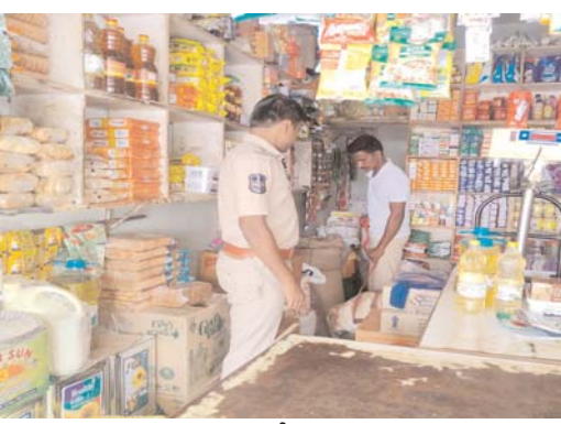
(అక్షర కలం, నారాయణపేట జిల్లా రిపోర్టర్, జూన్ 09)