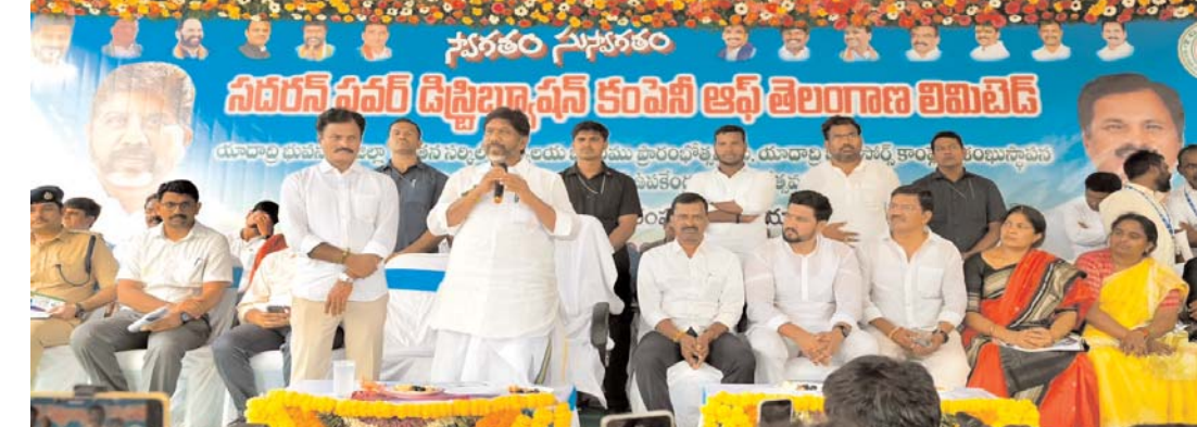
రూపాయి పన్ను పెంచలేదు..

ప్రజలపై నయాపైసలు అదనపు పన్ను భారం వేయకుండానే పాత వనరుల నుంచే సంక్షేమ విప్లవాన్ని సృష్టించామని ఆర్థిక మంత్రి లెక్కలతో సహా వివరించారు. మహిళలకు ఉచిత ఆర్డీని ప్రయోజనం పాటు వడ్డీ లేని రుణాల కింద కేవలం రెండున్నరేళ్లలోనే రూ. 67,000 కోట్లు ఇచ్చాం. రాబోయే ఐదేళ్లలో దీన్ని రూ. 1.25 లక్షల కోట్లకు పెంచుతాం. మహిళా సంస్థాల్లో బస్సులు కొని ఆర్డీని తిప్పేలా విప్లవాత్మక నిర్ణయం తీసుకున్నాం. కోటి 6 లక్షల పేద కుటుంబాలకు ప్రతి వ్యక్తికి 6 కిలోల చొప్పున రూ. 50-55 విలువైన సన్న బియ్యాన్ని ఉచితంగా అందిస్తున్న ఘనత మాదే. నాడు కేసీఆర్ ఎందుకు ఈ పని చేయలేకపోయారని ప్రశ్నించారు.