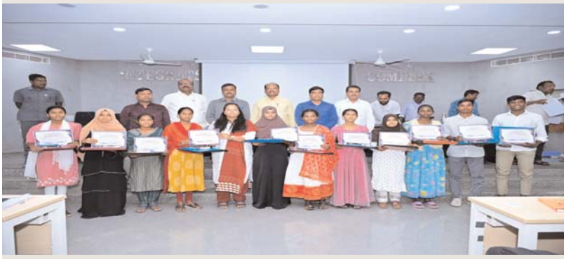
మెడక్/కొల్వారం జూన్ 09(అక్షర కలం):-