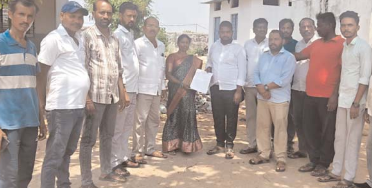
అక్షర కలం సిద్దిపేట జూన్ 06:

గ్రామ ప్రజలకు ముఖ్య గమనిక? మన పాఠశాల (వీరూ బద్దిపడగ) ఆవరణలో ఉన్న సెల్ టవర్ తొలగించు గురించి. ?మన గ్రామంలోని పాఠశాల ఆవరణకు ఆనుకొని ఏర్పాటు చేసిన సెల్ టవర్ వల్ల విద్యార్థుల ఆరోగ్యానికి, ముఖ్యంగా రేడియేషన్ ప్రభావం వల్ల ఇబ్బందులు కలిగే అవకాశం ఉందని పాఠశాల కమిటీ వారు గుర్తించారు. ?విద్యార్థుల భవిష్యత్తు మరియు ఆరోగ్య ప్రయోజనాలను దృష్టిలో ఉంచుకుని, ఆ సెల్ టవర్ను తక్షణమే తొలగించాలని కోరుతూ పాఠశాల ప్రధానోపాధ్యాయులు మరియు అమ్మ ఆదర్శ పాఠశాల కమిటీ చైర్మన్స్ గ్రామ సర్పంచ్ కి వివరిత పత్రం సమర్పించారు. ఈ విషయాన్ని తెలియజేసే వివరిత పత్రం యొక్క ప్రతిని "పై ఫోటో"లో చూడవచ్చు.?మన పిల్లల ఆరోగ్యం మనందరి బాధ్యత. ఈ విషయంలో గ్రామస్థులందరూ సహకరించవలసిందిగా కోరుతున్నాము.