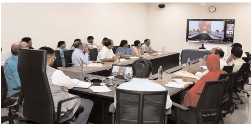
జోగులంబ గద్దార్ జిల్లా అక్షర కలం ప్రతినిధి