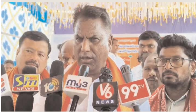
జగిత్యాల జూన్ 6 (అక్షర కలం)

బీఆర్ఎస్ వర్కింగ్ ప్రెసిడెంట్ కేటీఆర్ వి డైవర్షన్ పాలిటిక్స్ అని రాష్ట్ర సంక్షేమ శాఖ మంత్రి అడ్డూరి లక్ష్మణ్ కుమార్ అన్నారు. కాంగ్రెస్ పార్టీ అధికారంలోకి వచ్చిన తర్వాత సింగరేణిలో రూ. 1600 కోట్ల అవినీతి జరిగిందని కేటీఆర్ చేసిన వ్యాఖ్యలపై శనివారం వెలగట్టూర్ లో మీడియా అడిగిన ప్రశ్నలకు మంత్రి సమాధానం ఇచ్చారు. బీఆర్ఎస్ వర్కింగ్ ప్రెసిడెంట్ కేటీఆర్ కేంద్ర ప్రభుత్వానికి ఉత్తరం రాసే బదులు ప్రత్యక్షంగా పరోక్షంగా బీఆర్ఎస్ కు సహకారస్తున్న బిజెపి ప్రభుత్వంతో విచారణ చేయించమని మంత్రి అడ్డూరి అన్నారు. బీఆర్ఎస్ పార్టీ రోజూరోజూ ప్రజల్లో విశ్వాసం కోల్పోతుందని మంత్రి అన్నారు. పార్టీని కాపాడుకోవడానికి కేటీఆర్ ప్రభుత్వం పై తప్పుడు ఆరోపణలు చేస్తున్నారని మంత్రి పేర్కొన్నారు. మాజీ ముఖ్యమంత్రి ఫామోజుకు పరిమిత కావడం, ఇంట్లో కుటుంబ గౌరవం నేపథ్యంలో ఏం చేయాలో తెలియని కేటీఆర్ డైవర్షన్ పాలిటిక్స్ చేస్తున్నారని మంత్రి తెలిపారు.