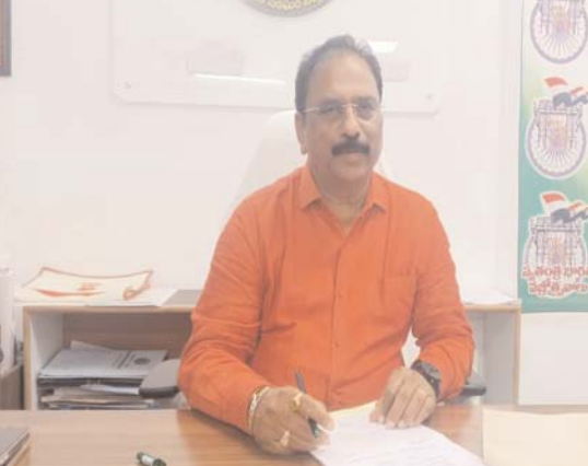
-రెండు కాదు.. ఇకపై నాలుగు రకాలు..

చెత్త (ఈ-వేస్ట్, పాడైపోయిన ఖోస్తు, బల్బులు, బ్యాటరీలు, మందుల సీసాలు) వీటిని అత్యంత జాగ్రత్తగా శాస్త్రీయ పద్ధతిలో నిర్వహించే యాల్ని ఉంటుంది. ఇంట్లోనే ఈ నాలుగు రకాల చెత్తను వేరు వేరు డబ్బాల్లో సేకరించి, మున్సిపల్ వాహనాలకు అందించడం ప్రతి ఒక్కరి బాధ్యత అని కమిషనర్ స్పష్టం చేశారు.