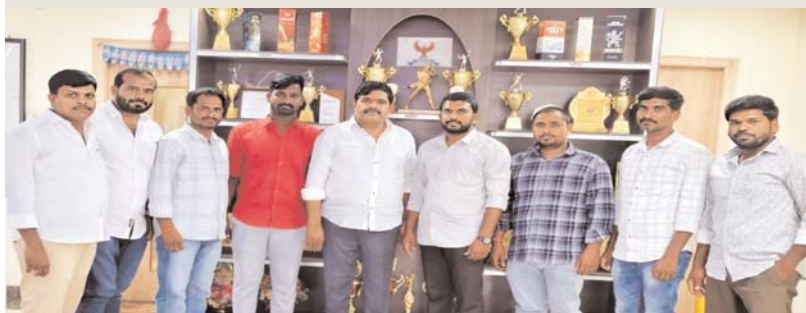
గుండీడ్, జూన్ 6 (అక్షర కలం):

బీఎస్ఆర్ సేవలను కొనియాడిన వెన్నుచేడ్ యువత