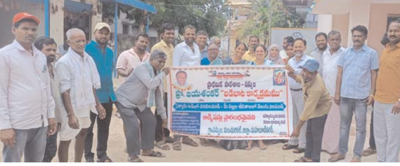
(అక్షర కలం, నారాయణపేట జిల్లా రిపోర్టర్, జూన్, 04)

- గ్రామ అభివృద్ధి అంశాలపై గ్రామసభ నిర్వహణ