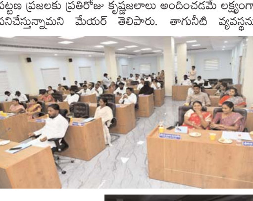
మరింత బలోపేతం చేసేందుకు, ప్రతి ఇంటికీ నిరంతరాయంగా నీరు సరఫరా చేసేందుకు రూ.100 కోట్లతో ప్రత్యేక ప్రణాళికలు సిద్ధం చేస్తున్నట్లు వెల్లడించారు.

టూరిజం హాట్ నల్గొండ.. నల్గొండ నగరాన్ని రాష్ట్రంలోనే అగ్రగామిగా నిలిపేందుకు రూ.303 కోట్ల వ్యయంతో వివిధ అభివృద్ధి పనులు జరుగుతున్నాయని మేయర్ వివరించారు. వీటితో పాటు అర్బన్ చార్టర్డ్ ఫండ్ (యు సి ఎఫ్) స్కీం కింద రూ.283 కోట్లతో నల్గొండను సుందరీకరించి, అద్భుతమైన టూరిజం హాట్ నల్గొండగా మారుస్తామని ధీమా వ్యక్తం చేశారు. ప్రస్తుతం ఎండ తీవ్రత వల్ల సీసీ రోడ్ల నిర్మాణం కాస్త ఆలస్యమవుతోందని, త్వరలోనే