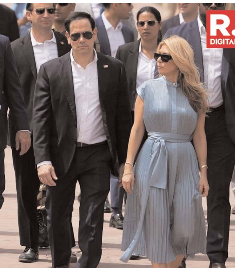
న్యూఢిల్లీ, అక్షరకలం ప్రతినిధి