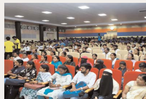
ఉమ్మడి నల్గొండ జ్యూర్ అక్షరకలం

యువత స్వయం వారి కాళ్ళపై వారు నిలబడేందుకు ప్రభుత్వం నైపుణ్యాభివృద్ధి శిక్షణలకు ప్రాధాన్యత ఇస్తున్నదని జిల్లా కలెక్టర్ బి. చంద్రశేఖర్ తెలిపారు. ప్రజా పాలన - ప్రగతి ప్రణాళిక 99 రోజుల కార్యచరణ లో భాగంగా చేపట్టిన యువజన వారోత్సవంలో యువతకు ప్రభుత్వం