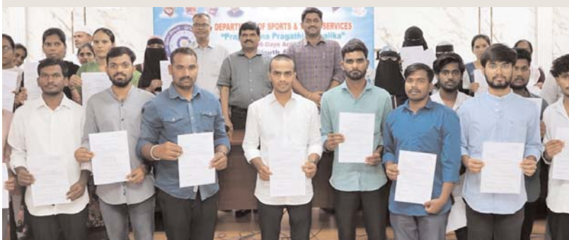
సంగారెడ్డి ప్రతినిధి, అక్షరకలం..

ఉద్యోగ అవకాశాలను సద్వినియోగం చేసుకొని జీవితంలో ఉన్నత స్థాయికి ఎదగాలి : అడిషనల్ కలెక్టర్ పాండు