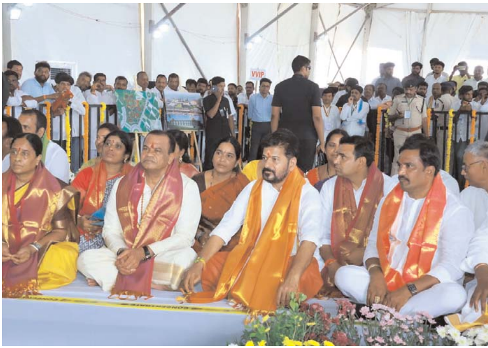
ఉమ్మడి నల్లగొండ జ్యూరో అక్షరకలం

ప్రముఖ పుణ్యక్షేత్రం యాదాద్రి భువనగిరి జిల్లాలోని శ్రీ లక్ష్మీ నరసింహ స్వామివారి ఆలయం మరింతగా ఆధ్యాత్మిక శోభను సంతరించుకోనుంది. శనివారం యాదాద్రి కొండపై రూ.99.55 కోట్ల భారీ వ్యయంతో చేపట్టనున్న పలు ఆలయ అనుబంధ అభివృద్ధి పనులకు రాష్ట్ర ముఖ్యమంత్రి ఎ. రేవంత్ రెడ్డి ఘనంగా శంకుస్థాపన చేశారు. ముందుగా కంచి కామకోటి పీఠాధిపతి శ్రీ విజయేంద్ర నరస్యతి స్వామి పర్యవేక్షణలో, వేద పండితుల మంత్రోచ్ఛారణల మధ్య అత్యంత వైభవంగా వేద పాఠశాల భూమి పూజ కార్యక్రమం జరిగింది. అనంతరం ముఖ్యమంత్రి రేవంత్ రెడ్డి చేతుల మీదుగా మిగిలిన అభివృద్ధి పనులకు శంకుస్థాపనల శిలాఫలకాలను ఆవిష్కరించారు. అభివృద్ధి పనులు మొత్తం రూ.99.55 కోట్ల నిధులతో చేపట్టనున్నారు.