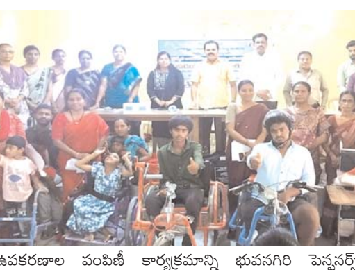
ఉపకరణాల పంపిణీ కార్యక్రమాన్ని భువనగిరి పెన్షనర్స్