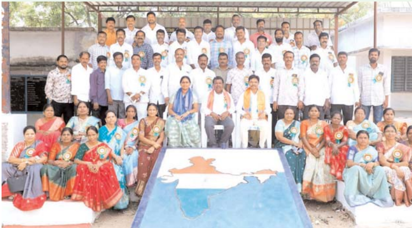
అక్షర కలం : చిట్టాల