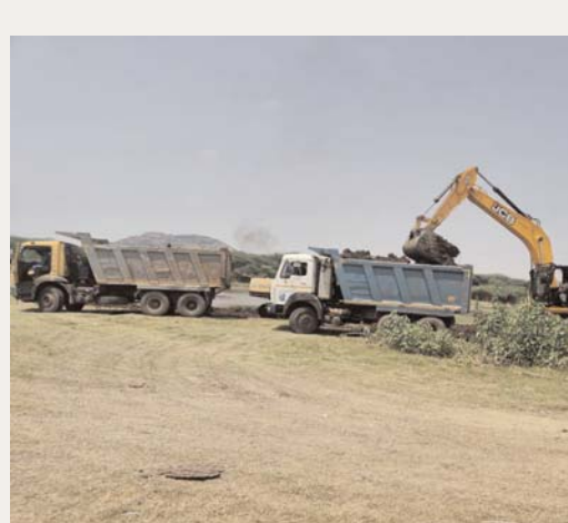
నాశనం చేస్తున్నారంటూ ఇటీవల గ్రామస్తులు స్వయంగా రంగంలోకి దిగి ఈ అక్రమ రవాణాను అడ్డుకున్నారు.

చెన్నారం గ్రామ పరిధిలో జరుగుతున్న ఈ అక్రమ మట్టి రవాణాపై స్థానిక ప్రజలు తీవ్ర ఆగ్రహం వ్యక్తం చేస్తున్నారు. ప్రకృతి సంపదను దోచేస్తూ, గ్రామానికి ఉన్న వనరులను