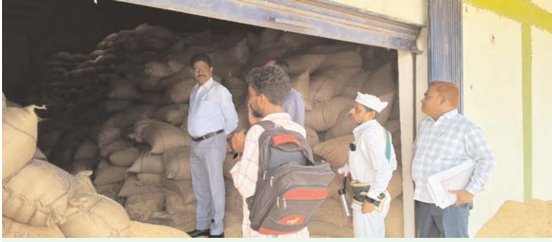
అక్షర కలం/కావేపల్లి :