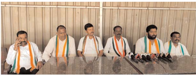
సంగారెడ్డి ప్రతినిధి, అక్షరకలం..