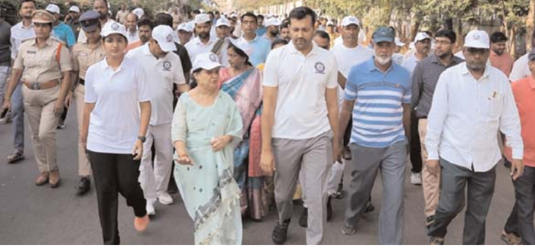
సంగారెడ్డి ప్రతినిధి, ఆక్షర కలం..