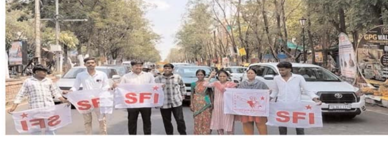
అక్షర కలం సిద్దిపేట మే 12: