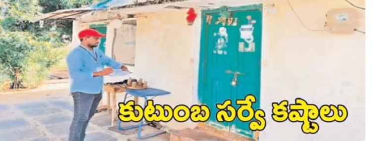
కుటుంబ సర్వే కష్టాలు

క్షేత్రస్థాయిలో ఇళ్ల సర్వే నిర్వహిస్తున్న ఎన్యూమరేటర్లు తీవ్ర ఇబ్బందులు ఎదుర్కొంటున్నారు. పట్టణ ప్రాంతాల్లో ఒక్కొక్కరికి ఏకంగా 200 ఇళ్ల సర్వే బాధ్యత అప్పగించడంతో పనిభారం పెరిగిందని వారు ఆవేదన వ్యక్తం చేస్తున్నారు. గ్రామీణ ప్రాంతాల్లో 70 ఇళ్లను కేటాయించగా, పట్టణాల్లో ఈ సంఖ్య రెట్టింపు కన్నా ఎక్కువగా ఉండటంపై వారు ఆందోళన వ్యక్తం చేస్తున్నారు. ప్రస్తుతం కొనసాగుతున్న ఎండల కారణంగా మహిళా ఎన్యూమరేటర్లు ఇళ్ల మధ్య తిరగలేక ఇబ్బందులు పడుతున్నారు. దీనికి తోడు ఇళ్లకు సంబంధించిన పేపర్లు సరిగా పడటం లేదని, దీనివల్ల సర్వే అలస్యమవుతోందని వాపోతున్నారు. రెండేసి వార్డులు, వందలాది ఇళ్లకు సర్వే చేయడం సాధ్యం కాదని, ఒక్కో ఎన్యూమరేటర్ కు 100 ఇళ్ల లోపు కేటాయించాలని లేదా ఆదనంగా సిబ్బందిని నియమించి పనిభారాన్ని తగ్గించాలని వారు ప్రభుత్వాన్ని కోరుతున్నారు.