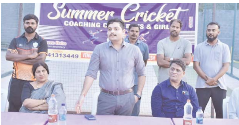
యాదాద్రి భువనగిరి అక్షర కలం

ఉచిత క్రికెట్ శిబిరాన్ని ప్రారంభించిన ఎస్పీ