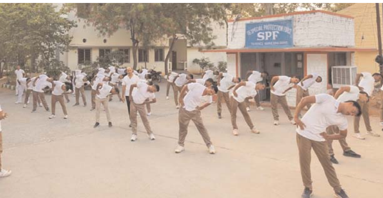
అక్షర కలం నాగార్జునసాగర్ / సందికొండ..