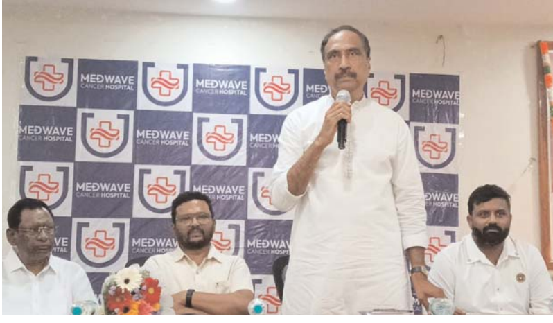
జగిత్యాల మే 12 (ఆక్షర కలం)