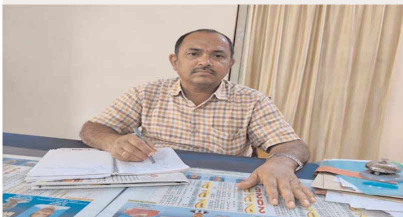
ఉమ్మడి సర్కార్ బ్యూరో అక్షరకలం

నేటి నుండి ఇంటర్మీడియట్ అడ్వాన్స్డ్ సస్టిమెంటరీ పరీక్షలు ఇంటర్మీడియట్ విద్యార్థికి దన్ను నాయక్