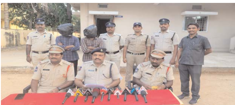
అక్షరకలం : చిట్టాల

---ఇద్దరు నిందితుల అరెస్టు, రిమాండ్ కు తరలింపు