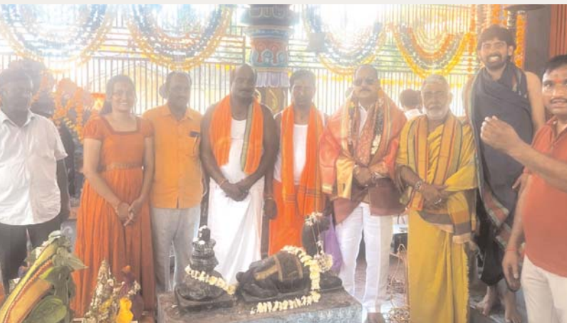
అక్షర కలం వీధీసగర్