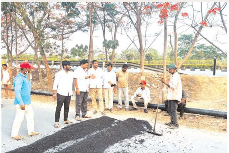
అక్షర కలం టీటీసీగర్

వేగ నియంత్రణ, రోడ్డు ప్రమాదాల నివారణకు చర్యలు