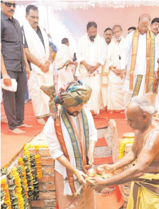
కొడంగల్ ను ఎడ్యుకేషన్ హబ్ గా మారుస్తా

430 పడకల ఆస్తులి నిర్మాణానికి శంకుస్థాపన మహాలక్ష్మి వేంకటేశ్వరస్వామి ఆలయ పునర్నిర్మాణం