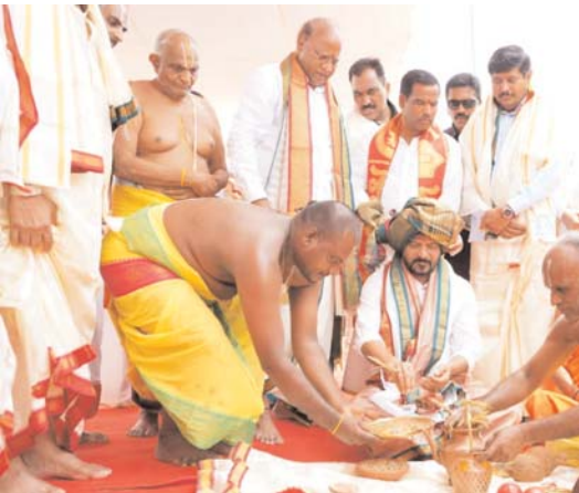
పథకాలు అమలు చేస్తున్నామని వివరించారు. శుక్రవారం వికారాబాద్ జిల్లాలోని సొంత నియోజకవర్గం కొడంగల్ లో సిఎం రేవంత్ రెడ్డి పర్యటించారు. 430 పడకల ఆస్తులి నిర్మాణం, దౌలాబాద్ వేంకటేశ్వర ఆలయం, కోస్ స్వేదనాశాలాస్వామి ఆలయాల అభివృద్ధి పనులకు సిఎం శంకుస్థాపనలు చేశారు. ఈ కార్యక్రమంలో మంత్రులు

దేశం మొత్తం కొడంగల్ వైపు చూసేలా అభివృద్ధి చేస్తామని తెలంగాణ ముఖ్యమంత్రి రేవంత్ రెడ్డి వ్యాఖ్యానించారు. కొడంగల్ ను ఎడ్యుకేషన్ హబ్ గా మారుస్తామని ఉద్ఘాటించారు. అందరి సహకారంతో రాష్ట్రాన్ని అభివృద్ధి చేస్తామని చెప్పుకొచ్చారు. పేదల సంక్షేమం కోసం తాము పనిచేస్తున్నామని పేర్కొన్నారు. తెలంగాణలో ఎన్నో సంక్షేమ