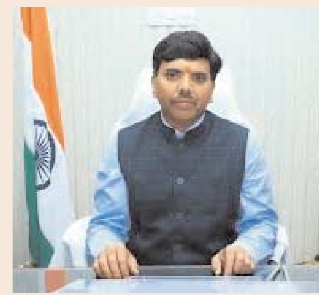
ఉమ్మడి నల్లగొండ జ్యూర్ అక్షరకలం