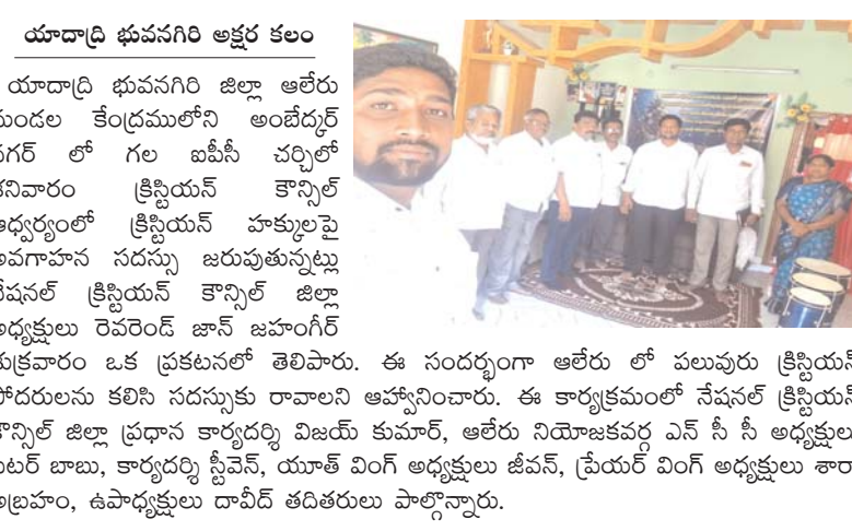
యాదాద్రి భువనగిరి అక్షర కలం