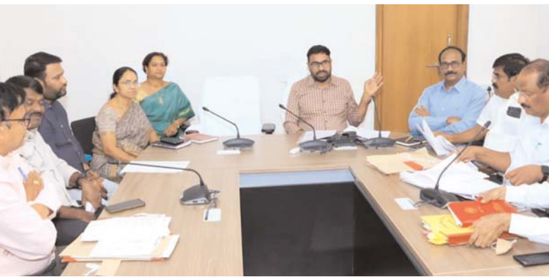
యాదాద్రి భువనగిరి అక్షర కలం