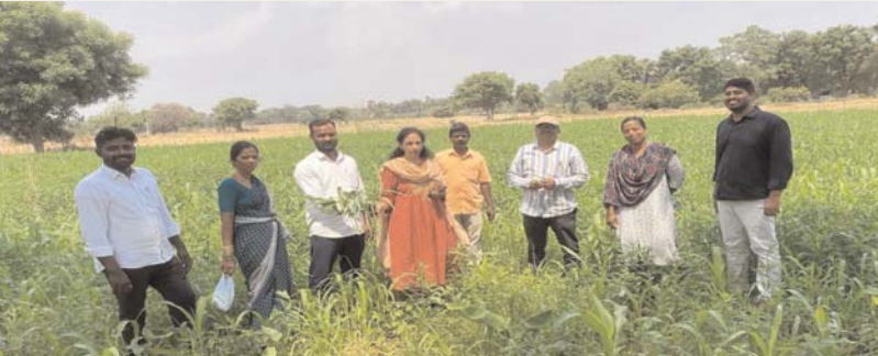
అక్షర కలం : నకిరేకల్ నియోజకవర్గం