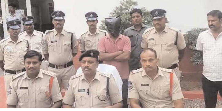
అక్షర కలం : నకిరేకల్ నియోజకవర్గం