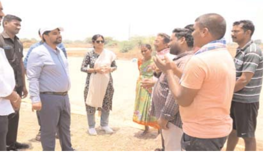
తరలించాలని, రైతులు ధాన్యాన్ని నిబంధనల ప్రకారం కొనుగోలు కేంద్రాలకు తీసుకురావాలని, రైతుల సౌకర్యార్థం కొనుగోలు కేంద్రాలలో త్రాగునీరు, నీడ సౌకర్యాలు కల్పించడంతో పాటు తూకం యంత్రాలు, ప్యాడి క్లీనర్లు ఇతర సదుపాయాలు కల్పించాలని తెలిపారు. రైతు వివరాలను సిస్టం లో నమోదు చేసి ఆధార్ కార్డు ద్వారా వారి గుర్తింపును