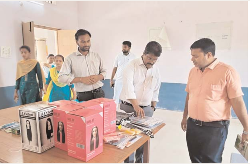
అక్షర కలం / భద్రాచలం