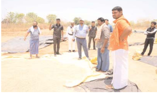
దృవీకరించాలని, రైతు భూమి విస్తీర్ణం, పండించిన ధాన్యం వివరాలను సరి చూడాలని, ధాన్యం నాణ్యత ప్రమాణాలకు అనుగుణంగా ఉండే విధంగా పరిశీలించాలని తెలిపారు. కొనుగోలు చేసిన ధాన్యానికి సంబంధించి రైతుల బ్యాంకు ఖాతాలలో నగదు జమ చేయడం జరుగుతుందని తెలిపారు. ఈ కార్యక్రమంలో సంబంధిత అధికారులు పాల్గొన్నారు.