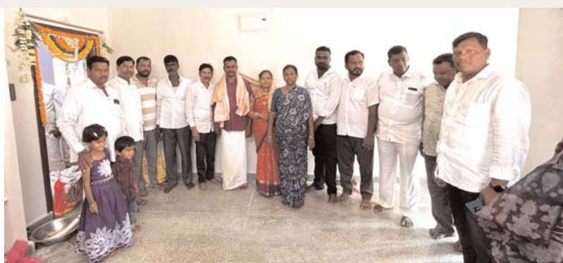
అక్షర కలం వీధీసగర్

జమీలాపేట లో ఇందిరమ్మ ఇళ్ల గృహ ప్రవేశంలో పాల్గొన్న సర్పంచ్, కాంగ్రెస్ పార్టీ నాయకులు