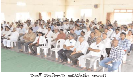
సైబర్ మోసాలపై అప్రమత్తం కావాలి

డిజిటిల్ అరెస్ట్ మోసాలు, ఆన్లైన్ టిక్కెట్ బుకింగ్ మోసాలు, ఫేక్ కాల్స్, మెసేజింగ్ ద్వారా డబ్బులు దోచుకునే ఘటనలు పెరుగుతున్నాయని ఎస్పీ హెచ్చరించారు. తెలియని లింకులు క్లిక్ చేయకుండా, అనుమానాస్పద కాల్స్ కు స్పందించకుండా, వ్యక్తిగత, బ్యాంకింగ్ వివరాలను ఎవరితోనూ పంచుకోవద్దని సూచించారు.