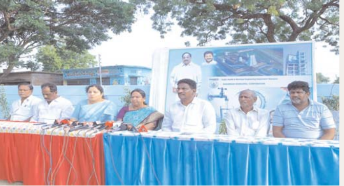
రూ.100 కోట్లతో మౌలిక సదుపాయాల విస్తరణ

ఖమ్మం నగరంలో డీఎఫ్టీ అధ్వర్యంలో 20 ఎకరాల్లో