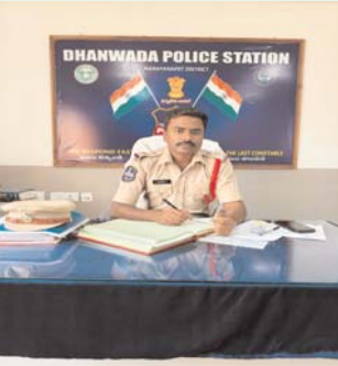
భాన్వాడ పోలీస్ స్టేషన్

వేసవి కాలం ప్రారంభమైన నేపథ్యంలో గ్రామాల్లోని చెరువులు, కాలువల వద్ద చిన్న పిల్లలు ఈత కోసం వెళ్లే అవకాశం ఎక్కువగా ఉంటుంది. ఈ సమయంలో తల్లిదండ్రులు అప్రమత్తంగా ఉండి, పిల్లలను ఒంటరిగా నీటి వనరుల వద్దకు పంపకుండా గట్టి పర్యవేక్షణ చేయాలని స్థానికులు, అధికారులు సూచిస్తున్నారు. పిల్లలు చెరువుల్లో ఈత కొట్టేటప్పుడు పెద్దవారి పర్యవేక్షణ తప్పనిసరి. మంచి ఈత తెలిసిన పెద్దవారు దగ్గరుండాలి. చిన్నారులు ఎప్పుడూ ఒంటరిగా చెరువులోకి వెళ్లకూడదు. నీటిలోకి దిగే ముందు లోతు, నీల పరిస్థితి తెలుసుకోవాలి. చెరువుల్లో ఒక్కసారిగా లోతు పెరిగే అవకాశం ఉంది. కింద మట్టి, గుంటలు, రాళ్లు ఉండే ప్రమాదం కూడా ఉంది. చిన్న పిల్లలకు జీవన రక్షణ బట్ట తప్పనిసరిగా వేయాలి. నీటిలో మెట్టలు లేకుండా ఈత కొట్టడం ప్రమాదకరం. నీటి ప్రవాహం, అలల విషయంలో జాగ్రత్త తీసుకోవాలి. కొన్నిసార్లు చెరువుల్లో కూడా నీటి దాఠలు ఉండే అవకాశం ఉంటుంది. పిల్లలను లోపలికి ఎక్కువ దూరం వెళ్లనివ్వకూడదు. చెరువు నీటిలో కిర్రులు, సూక్ష్మజీవులు ఉండే అవకాశం ఉంది. గాయాలు ఉన్నప్పుడు నీటిలోకి పంపకూడదు. దూకడం పూర్తిగా నివారించాలి. కింద ఏముందో తెలియక గాయాల ప్రమాదం ఎక్కువ. చెరువులోని నీటి మొక్కలు, గడ్డి కాళ్లకు చిక్కుకునే అవకాశం ఉంది. భయపడకుండా నెమ్మదిగా బయటకు రావాలి. చెరువు పరిసరాల్లో జారే ప్రదేశాలు, మట్టిబారిన చోట్ల పరుగు పెట్టకూడదు. వర్షాకాలంలో నీటి స్థాయి, ప్రవాహం మారిపోతాయి. మట్టిగా, మబ్బుగా ఉన్న నీటిలో ప్రమాదం మరింత ఎక్కువ. ఎక్కువసేపు నీటిలో ఉండనివ్వకూడదు. అలసట వచ్చిన వెంటనే బయటకు రావాలి. పిల్లల ఆనందం కంటే వారి ప్రాణ భద్రతే ముఖ్యమని, ప్రతి తల్లిదండ్రులు ఈ విషయంలో అప్రమత్తంగా ఉండాలని స్థానికులు కోరుతున్నారు.