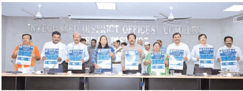
మెడక్ /కొల్తూరు మే 06(అక్షర కలం):-