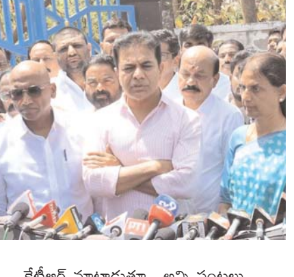
కేటీఆర్ మాట్లాడుతున్న.. అన్ని పంటలు

కొనుగోలు చేయమని చెప్పి రైతులను ఈ ప్రభుత్వంలోని నేతల పచ్చి మోసం చేశారని విమర్శించారు. రాష్ట్రంలో ఏ పంట కూడా సరిగ్గా కొనుగోలు చేయడం లేదంటూ ప్రభుత్వ తీరును ఈ సందర్భంగా ఆయన ఎండగట్టారు. 95 లక్షల మెట్రిక్ టన్నుల వరి కొనుగోలు చేయాల్సి ఉండగా.. కేవలం 9 లక్షల మెట్రిక్ టన్నుల ధాన్యమే కొనుగోలు చేశారని తెలిపారు. కొనుగోలు కేంద్రాలు ఇప్పటికీ ప్రారంభించ లేదన్నారు. ధాన్యం దళారుల పాలు చేయాలన్నదే కాంగ్రెస్ ప్రభుత్వ లక్ష్యమని కేటీఆర్ కుండ బద్దలు కొట్టారు. సీఎం కేసీఆర్ హయాంలో 11 సార్లు రైతు బంధు వేశారని కేటీఆర్ గర్భం చేశారు.