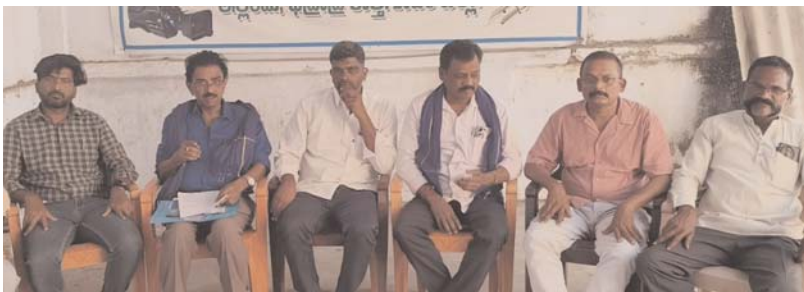
అక్షర కలం / ఇద్దెందులూరు.