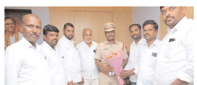
అక్షర కలం, చందూరు