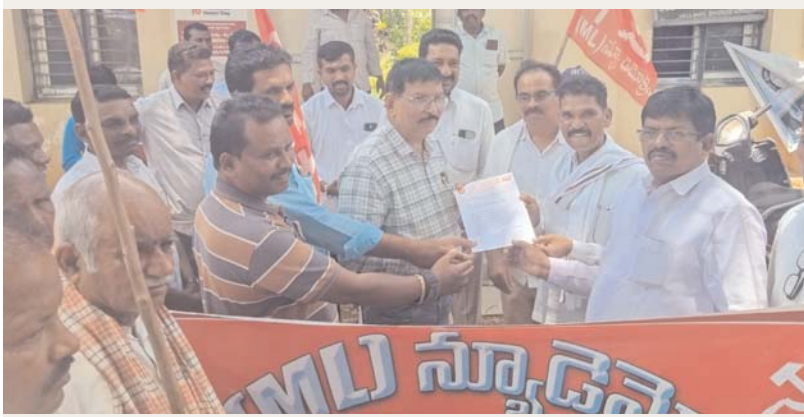
అక్షర కలం / ఇల్లందు.

పంట సప్తపోయిన రైతులను ప్రభుత్వం ఆదుకోవాలి. అవుసారి పుడుచిమాండ్.