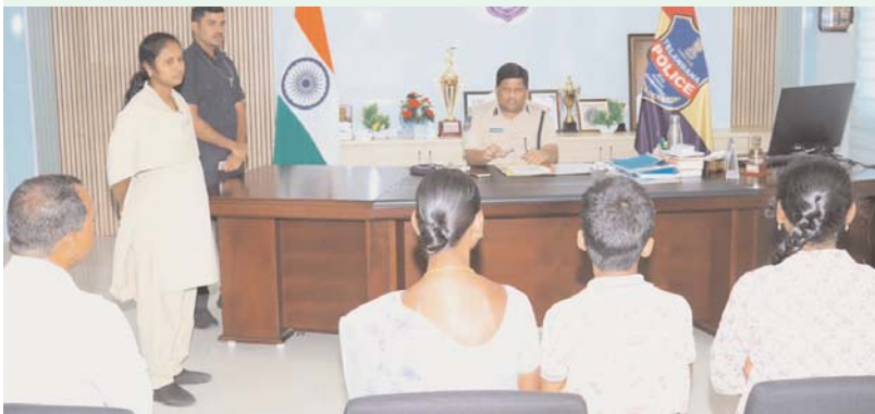
మెడక్ /కొల్తూరు మే 04(అక్షర కలం):-