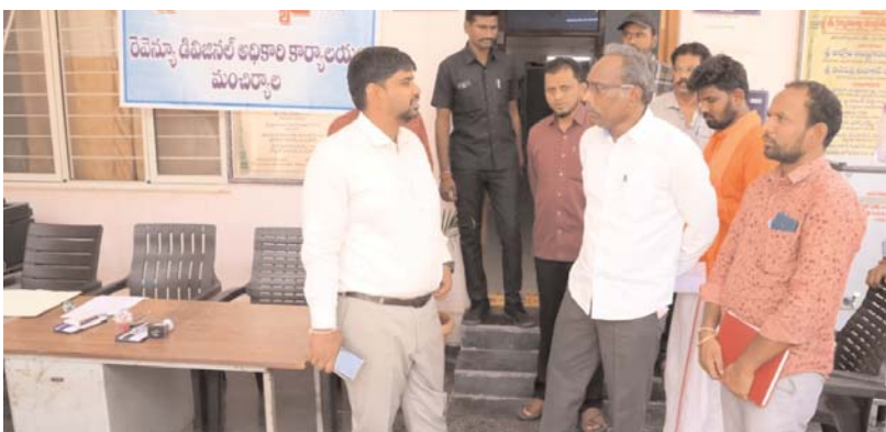
అక్షర కలం, మంచిర్యాల జిల్లా ప్రతినిధి, మే 04:

డివిజన్ స్థాయి ప్రజావాణి కార్యక్రమాన్ని సమర్థవంతంగా నిర్వహించాలని జిల్లా కలెక్టర్ కుమార్ దీపిక తెలిపారు. సోమవారం జిల్లాలోని బెల్లంపల్లి డివిజన్ పరిధిలో బెల్లంపల్లి తహశీల్దార్ కార్యాలయంలో ఏర్పాటు చేసిన ప్రజావాణి కార్యక్రమాన్ని బెల్లంపల్లి సబ్ కలెక్టర్ మనోజ్ తో కలిసి సందర్శించారు. ఈ సందర్భంగా జిల్లా కలెక్టర్ కుమార్ దీపిక మాట్లాడుతూ, ప్రజా సమస్యల పరిష్కారం కొరకు నిర్వహిస్తున్న ప్రజావాణి కార్యక్రమాన్ని రెవెన్యూ డివిజన్ స్థాయిలో నోడల్ అధికారిగా రాజస్వ మండల అధికారిని నియమించి తగు చర్యలు చేపట్టడం జరుగుతుందని తెలిపారు. ప్రజావాణి కార్యక్రమంలో దరఖాస్తు స్వీకరించిన 30 రోజులలోగా పరిష్కరించాలని, లేని పక్షంలో తీరస్పర్షణ, అందుకు గల కారణాలతో దరఖాస్తుదారులకు సమాచారం అందించాలని తెలిపారు. ప్రజావాణిలో స్వీకరించిన దరఖాస్తుల సంబంధిత వివరాలను పోర్టల్ లో సమాధానం చేసి అధికారులకు రసీదు అందించాలని, దరఖాస్తుదారులు ప్రజావాణి పోర్టల్ లో తమ దరఖాస్తు స్థితిని తెలుసుకోవచ్చని తెలిపారు. దరఖాస్తులు సమర్పించడానికి వచ్చే ప్రజలకు త్రాగునీరు, కుర్చీలు, అత్యవసర వైద్య సేవలను అందుబాటులో ఉంచాలని తెలిపారు. ఆసనం మంచిర్యాల పట్టణంలోని మంచిర్యాల రాజస్వ మండల అధికారి కార్యాలయంలో చేపట్టిన ప్రజావాణి కార్యక్రమం తీరును పరిశీలించి అధికారులకు పలు సూచనలు చేశారు. ఈ కార్యక్రమంలో సంబంధిత అధికారులు తదితరులు పాల్గొన్నారు.