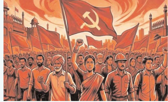
వస్తున్నాయి. కార్మికుడికి అండగా ఉండాలి.. ఎక్కడ ఉందని పలువురు ప్రశ్నిస్తున్నారు. ప్రభుత్వ నిబంధనల ప్రకారం కార్మిక శాఖ ప్రధానంగా మూడు అంశాలపై దృష్టి పెట్టాలి

నేడు మనం అనుభవిస్తున్న ఎనిమిది గంటల పనిదినం ఊరికే రాలేదు. అది చికాగో వీధుల్లో కార్మికులు వివిధ రకపు ధారల ఫలితం. ఆ పోరాట స్ఫూర్తితోనే నేడు ప్రపంచవ్యాప్తంగా కార్మికుల లోకం తమ హక్కుల కోసం గళం విప్పుతోంది. నిర్మాణ రంగం.. ప్రాణాలకు తెగించి ఆకాశహర్యాలను నిర్మించే భవన నిర్మాణ కార్మికులు, పరిశ్రమల.. యంత్రాలతో పోటీపడుతూ దేశ ఆర్థిక చక్రం ఆగకుండా చూసే పారిశ్రామిక వేత్తలు, పారిశ్రామిక ధ్యం.. ఊరు వాడ శుభ్రంగా ఉంచేందుకు తమ ఆరోగ్యాన్ని