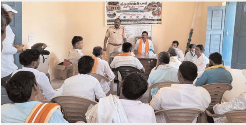
(అక్షర కలం, నారాయణపేట జిల్లా రిపోర్టర్, ఏప్రిల్, 30)