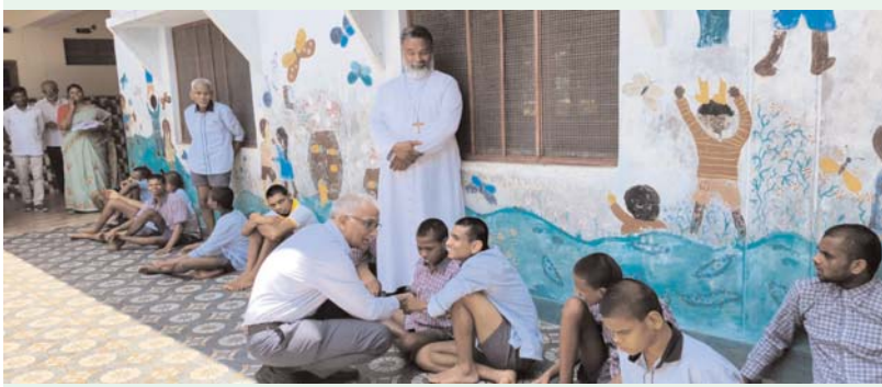
మెడక్/కొల్హారం ఏప్రిల్ 30(ఆక్షర కలం):-

సఖి సెంటర్లో బాధితులకు అత్యుత్తమ సేవలు అందాలని మెడక్ జిల్లాలో అంగన్వాడీల పనితీరు ఆదర్శంగా ఉందని మహిళా, శిశు అభివృద్ధి మంత్రిత్వ శాఖ అదనపు కార్యదర్శి నోడల్ అధికారి చల్లెటి ప్రేమ్ చంద్ అన్నారు. గురువారం నర్సాపూర్ పరిధిలో నిర్వహిస్తున్న సఖి - కేంద్రము. రెడ్డిపల్లి అంగన్వాడీ సెంటర్ ను మహిళా, శిశు అభివృద్ధి మంత్రిత్వ శాఖ అదనపు కార్యదర్శి నోడల్ అధికారి చల్లెటి ప్రేమ్ చంద్ తనిఖీ చేశారు. ముందుగా సఖి సెంటర్లో రిజిస్ట్రేషన్ తనిఖీ చేస్తూ క్లిష్టమైన కేసులను గురించి అడిగి తెలుసుకున్నారు. అలాగే మహిళలు పని చేసే చోట కలిగి ఉన్న ఇబ్బందులను గురించి మహిళలపై లైంగిక దాడి చట్టము పై కూడా అవగాహన కార్యక్రమాలను చేపట్టాలన్నారు. ఆనంతరం అంగన్వాడీ సెంటర్ ను పరిశీలించి గర్భిణులు, బాలింతలకు పోషక విలువలను అహార పదార్థాలపై సంపూర్ణ అవగాహన కల్పించాలని సూచించారు. పోషక అభియాన్ కార్యక్రమంలో తల్లిబిడ్డలకు సంపూర్ణ పోషకాహారం అందించాలని సూచించారు. ఈ కార్యక్రమంలో జిల్లా సంక్షేమ అధికారి హేమ భార్య, సంబంధిత అంగన్వాడీ సిడిపిలు, అంగన్వాడీ టీచర్లు తదితరులు పాల్గొన్నారు.