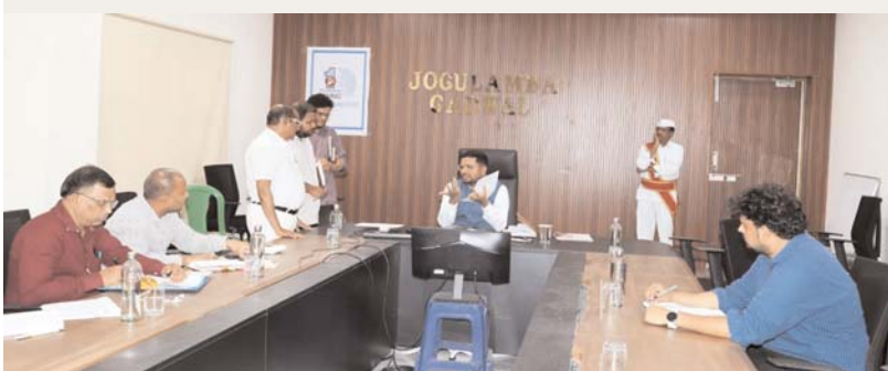
గద్వాల అక్షర కలం