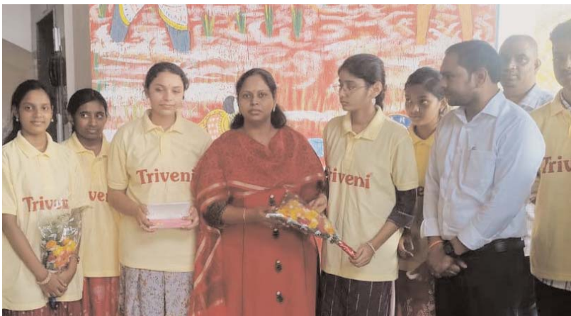
అక్షర కలం/ ఖమ్మం ప్రతినిధి: