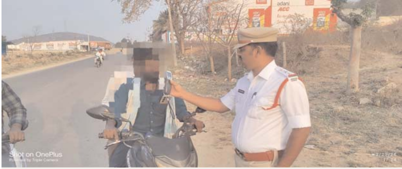
మహబూబ్ నగర్, ఏప్రిల్ 30, అక్షర కలం :