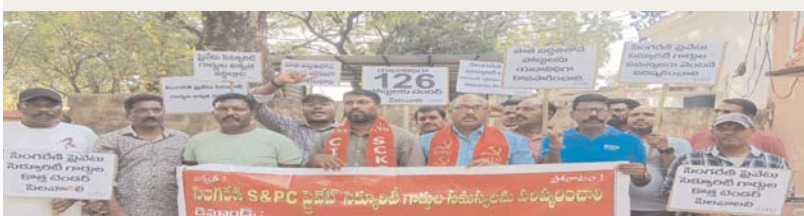
మండపల్లి, ఏప్రిల్ 22 అక్షర కలం: