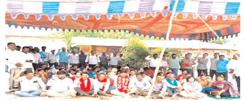
యాదాద్రి భువనగిరి అక్షర కలం