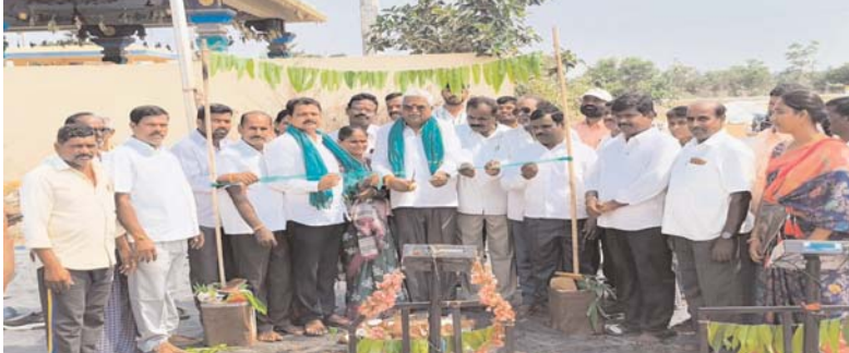
వలిగొండ అక్షర కలం