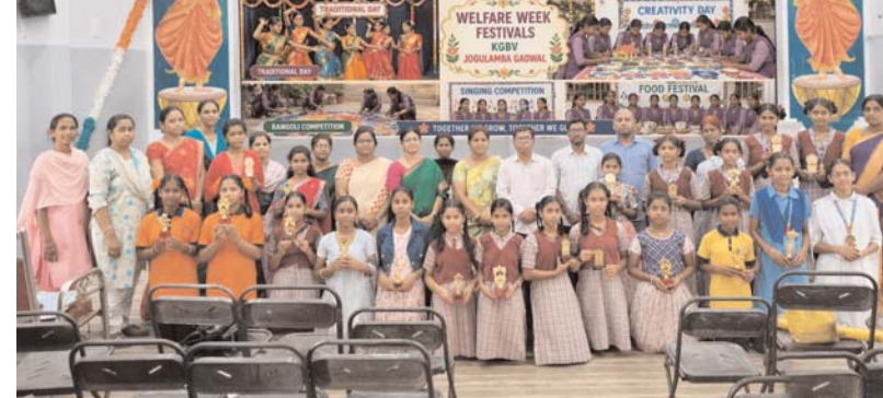
గద్వాల అక్షర కలం