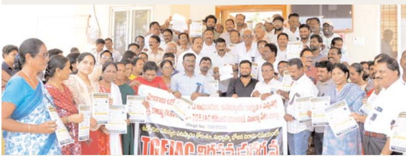
అక్షర కలం కోదాడ

కోదాడ ఆర్టీవో ఆఫీస్ వద్ద తెలంగాణ ఉద్యోగుల, పెన్షనర్ల జాయింట్ యాక్షన్ కమిటీ నిరసన