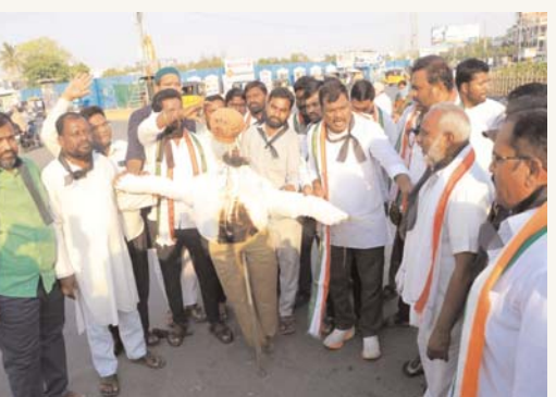
ఉమ్మడి నల్గొండ బ్యారో అక్షరకలం