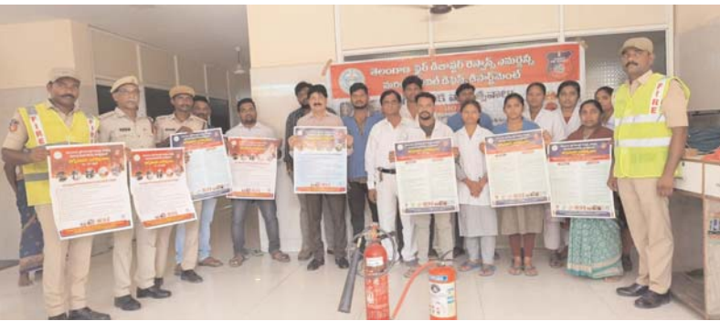
ఆక్షర కలం / భద్రాచలం