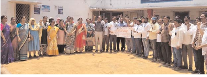
హన్మడ, ఏప్రిల్ 17. ఆక్షర కలం: