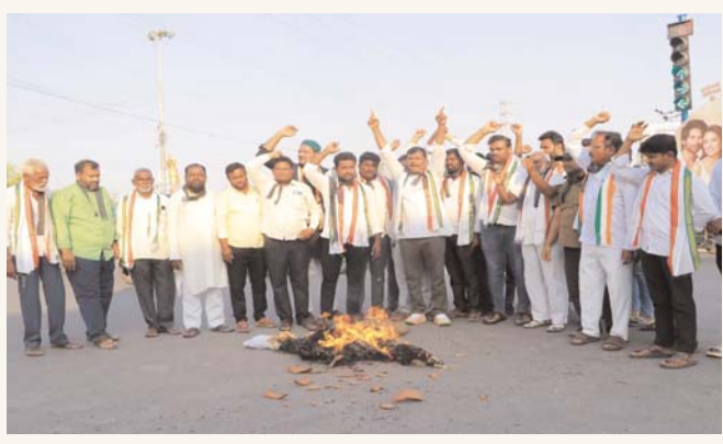
విభజనతో పోల్చడం తెలంగాణ ప్రజల త్యాగాలను అవహేళన చేయడమే అని మండిపడ్డారు.

నల్గొండలో ఎంపీ దిష్టిబొమ్మ దహనం తెలంగాణ ఏర్పాటును పాకిస్తాన్ విభజనతో పోల్చడంపై డి.సీ.సీ అధ్యక్షులు కైలాష్ నేత ఆగ్రహం