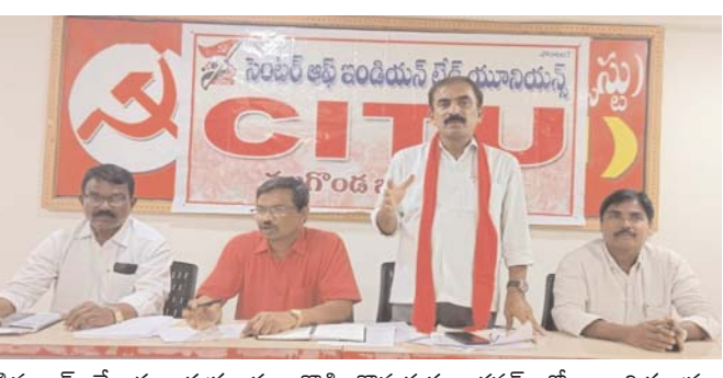
డిమాండ్ చేశారు. శుక్రవారం దౌడ్డి కొమరయ్య భవన్ లో సిబిటియూ జిల్లా కమిటీ సమావేశం జరిగింది ఈ సందర్భంగా ఆయన మాట్లాడుతూ ఉత్తరప్రదేశ్ హయానా ఢిల్లీ పరిసర ప్రాంతాలైన నోయిడాలో సుమారు 50 వేల మంది కార్మికులు పోరాటంలో ఉంటే కార్పొరేట్ యజమాన్యాలకు బిజెపి ప్రభుత్వం పోలీసు నిర్బంధాన్ని ప్రయోగించి అక్రమ అరెస్టులు చేస్తుందని ఆరోపించారు. తెలంగాణ రాష్ట్రంలో కాంగ్రెస్ పార్టీ ఎన్నికల మేనిఫెస్టోలో కార్మికులకు హామీలు ఇచ్చి అమలు చేయకపోవడంతో బడ్డెట్ సమావేశాల సందర్భంగా చలో హైదరాబాద్ సందర్భంగా అంగన్వాడీ ఆశ గ్రామసంచాయితీ వివో ఏ లు అర్ధరాత్రి ముందస్తు అరెస్టు చేసి చలో అసెంబ్లీలో భగ్నం చేయడానికి నిర్బంధాన్ని ప్రయోగించిందని ఆరోపించారు. కనీస వేతనాల జి.ఓ.ల సవరించడంలో, కార్మిక హక్కులు రక్షించడంలో కాంగ్రెస్ ప్రభుత్వం విఫలమైందని అన్నారు. సిబిటియూ జిల్లా కార్యదర్శి ఎం.డి. సలీం మాట్లాడుతూ

సిబిటియూ డిమాండ్ కార్పొరేట్ శక్తులకు కేంద్రం కొమ్ముకాస్తోంది తుమ్మల వీరారెడ్డి ధ్వజం ఉత్తరాది కార్మికుల అక్రమ అరెస్టులకు ఖండన చలో అసెంబ్లీ నిర్బంధంపై ఆగ్రహం మే 1 నుండి 19 వరకు సాంస్కృతిక, చైతన్య కార్యక్రమాలు ఉమ్మడి నల్గొండ బ్యారో అక్షరకలం