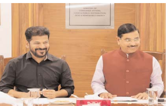
న్యూఢిల్లీ, అక్షరకలం ప్రతినిధి

2025-26 వానాకాలం, యాసంగి సీజన్కు సంబంధించి 30 లక్షల మెట్రిక్ టన్నుల పాఠాన్ని డ్యూమ్ సేకరించాలని కేంద్రమంత్రికి సీఎం రేవంత్, మంతరి ఉత్తమ్ విజ్ఞప్తి