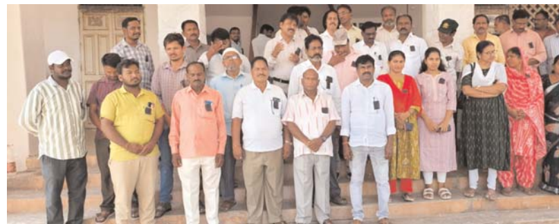
అక్షర కలం నాగార్జునసాగర్/ సందికొండ