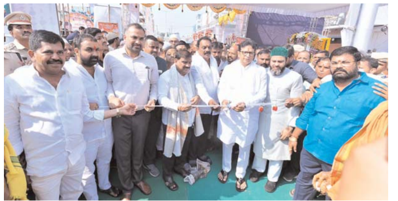
హైదరాబాద్, అక్షరకలం ప్రతినిధి

హైదరాబాద్ నగర అభివృద్ధిలో కీలక అడుగుపడింది. నగరంలో మరో ఆర్ఎఫ్డీ ప్రజలకు అందుబాటులోకి వచ్చింది. శుక్రవారం శాస్త్రిపురం రైల్వే ఓవర్ బ్రిడ్జిను మంత్రి శ్రీధర్ బాబు ప్రారంభించారు. ఈ పై ఓవర్ నిర్మాణానికి జీహెచ్ఎస్సీ 71 కోట్ల రూపాయలు ఖర్చు చేసింది. సుమారు 490 మీటర్ల పొడవుతో, నాలుగు లైన్లలో పై ఓవర్ బిల్డ్ చేసినట్లు నిర్మించింది. జీహెచ్ఎస్సీ, సౌత్ సెంట్రల్ రైల్వేల సమన్వయంతో ఈ ప్రాజెక్టును చేపట్టారు. శాస్త్రిపురం పై ఓవర్ అందుబాటులోకి రావడంతో మైలార్ దేవపల్లి నుంచి ఫలక్నిమూ మార్గంలో ప్రయాణం సులభతరం అయింది. ఉద్దమర్ష రైల్వే లైన్లో క్రాసింగ్ వద్ద ఏర్పడిన ట్రాఫిక్ జామ్ను చెక్ చేడవచ్చింది. ప్రయాణ సమయం కూడా చాలా వరకు తగ్గుతుంది. ఈ ++-లక్షలతో ద్వారా మైలార్ దేవపల్లి, వైద్యపల్లి, ఫలక్నిమూ, ఆర్డీసీ బస్ డిపో ప్రాంతాల మధ్య కనెక్టివిటీ మెరుగుపడింది.