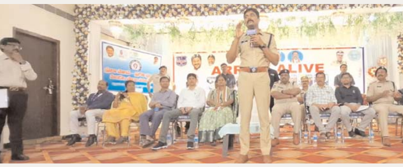
అక్షర కలం / ఇద్దెండు.