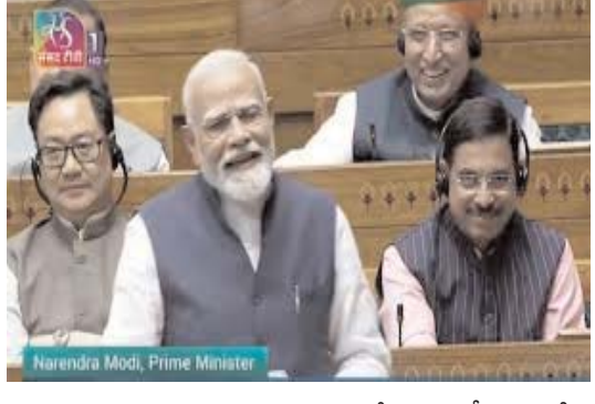
Narendra Modi, Prime Minister

మహిళా రిజర్వేషన్ బిల్లును రాజకీయ కోణంలో చూడవద్దు అని ప్రధాని మోడీ అన్నారు. మహిళా రిజర్వేషన్ బిల్లు పార్టీకి అనుకూలం కాదు అన్నారు. దానికి రాజకీయ రంగం పూయవద్దు అన్నారు. ఎవరు బాధ్యులైనా, ఇప్పటికే మహిళా రిజర్వేషన్ బిల్లును అలస్యం చేశామన్నారు. ఈ బిల్లులను తీసుకువచ్చిన సత్కెన్ బ్రెజిల్ బెంచెలకు కానీ, మోడీకి కానీ దక్కదని, ఇది భారత ప్రజాస్వామ్యానికి దక్కతుందని ఆయన అన్నారు. లోక్ సభలో డీలిమిటేషన్, మహిళా రిజర్వేషన్ బిల్లులను ప్రవేశపెట్టిన నేపథ్యంలో ప్రధాని మోడీ ప్రసంగించారు. పార్లమెంట్ ప్రత్యేక సమావేశాల్లో ప్రవేశపెట్టిన 131వ రాజ్యాంగ సవరణ బిల్లుపై ప్రధాని సందేహం వ్యక్తం చేశారు. ఈ సందర్భంగా ఆయన మాట్లాడుతూ.. మహిళా రిజర్వేషన్ బిల్లు అంశంలో క్రెడిట్ ఎవరిదన్న దానిపై ఆలోచించరాదు అన్నారు. కావాలంటే మారు క్రెడిట్ తీసుకోవచ్చు అని ఆయన ప్రతిపక్షాలకు చెప్పారు. ముందుగా 33 శాతం మంది మహిళలు ఇక్కడకు రావాలన్నారు. భారతీయ సోదరీమణులను నమ్మండి అని, వారి ఇంటిలిజెన్స్ ను గుర్తించాలన్నారు. నారీ శక్తి వికసిత భారత్ కు ఉపయోగపడుతుందన్నారు. మనం తీసుకోవాలి నిర్ణయాన్ని మహిళలు వీక్షిస్తున్నారని, మన ఉద్దేశాలను కూడా గమనిస్తున్నారన్నారు. మహిళా రిజర్వేషన్ పత్రీయను మరింత అలస్యం చేయవద్దు అన్నారు. రాజ్యాంగ సవరణ బిల్లుతో ఏ రాష్ట్రానికి అన్యాయం జరగదు అని, ఎవర్నీ విపక్షపాలితంగా చూడబోమన్నారు. అలాగే దక్షిణాదికి అన్యాయం అంటున్న వాదనలో కూడా వాస్తవం లేదన్నారు. మహిళా రిజర్వేషన్ బిల్లు విషయంలో తనకు క్రెడిట్ అవసరం లేదని మోడీ అన్నారు. ఒకవేళ బిల్లు పాస్ అవుతుంటే, ఎవర్నీ అధికారంలోకి వారి పేరు, ఫోటో మీద పుల్ పేజీ యాద్ ఇవ్వమన్నట్లు చెప్పారు. మహిళా రిజర్వేషన్ బిల్లును అందరి అభీష్టమంటా