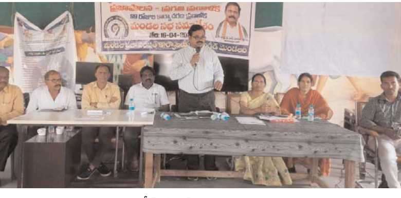
గండీడ్, ఏప్రిల్ 16, అక్షర కలం :

రైతు వేదికగా సమస్యల వెల్లువ... అభివృద్ధి దిశగా అధికారుల హామీ