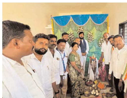
అలాగే స్థానిక కాంగ్రెస్ నాయకులు