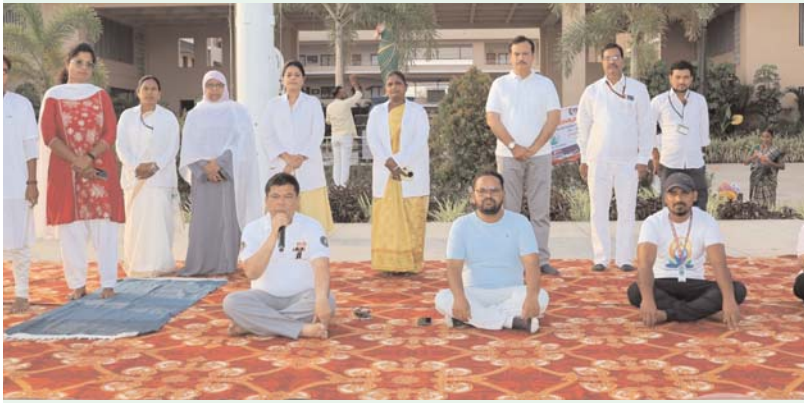
గద్వాల, అక్షర కలం (ఏప్రిల్ 10):-