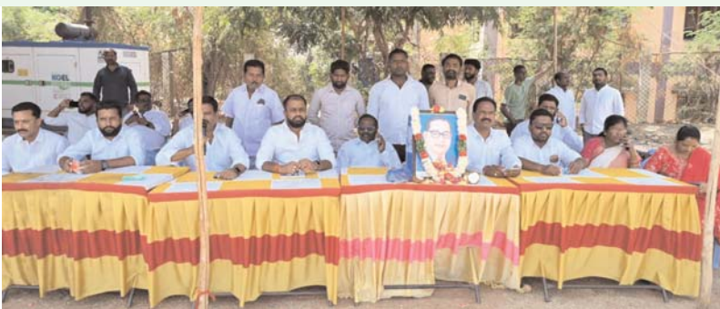
అక్షర కలం సిద్దిపేట ఏప్రిల్ 10: