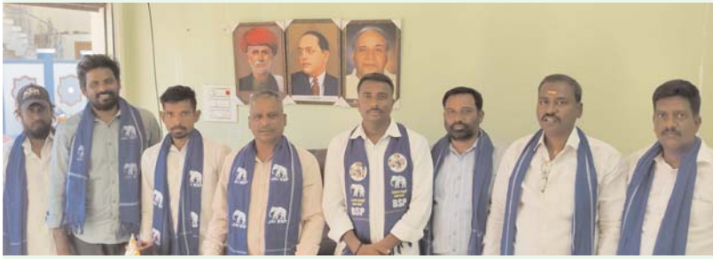
అక్షర కలం సిద్దిపేట ఏప్రిల్ 10: