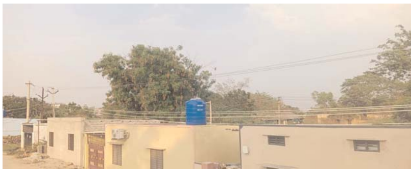
అక్షర కలం నాగార్జునసాగర్ / నందికొండ