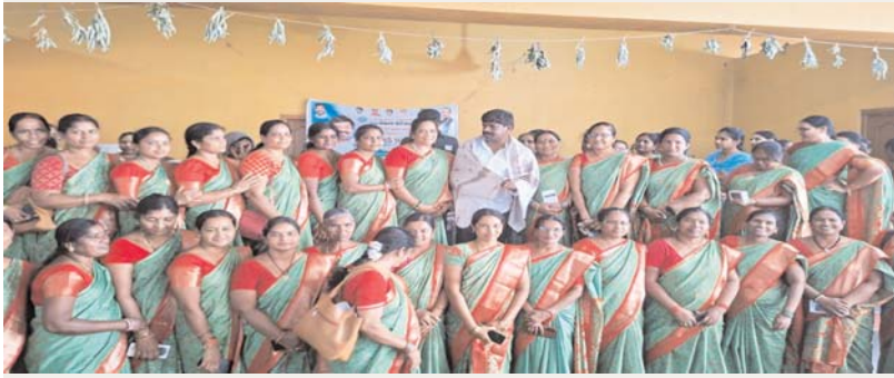
అక్షర కలం : నకిరేకల్ నియోజకవర్గం

విద్యార్థుల ఆరోగ్యం, గర్భిణుల సంరక్షణలో కీలక పాత్ర పోషిస్తున్న అంగన్వాడీ టీచర్ల సేవలను మరింత వేగవంతం చేసేందుకు ప్రభుత్వం సాంకేతికతను అందిస్తోంది. ఇందులో భాగంగా నకిరేకల్ పట్టణంలోని గీతా మందిర ఫంక్షన్ హాల్లో ఐసిడిఎస్ అధ్యక్షులతో ఏర్పాటు చేసిన కార్యక్రమంలో, ప్రభుత్వ విప్ నకిరేకల్ ఎమ్మెల్యే వేముల వీరేశం అంగన్వాడీ టీచర్లకు స్టార్ట్ ఫోన్లను అందజేశారు. ఈ సందర్భంగా చిట్టాల మండలానికి చెందిన అంగన్వాడీ టీచర్లు ఎమ్మెల్యే వేముల వీరేశం పూలగుచ్చాలతో సాదరంగా ఆహ్వానించి, శాలువాతో ఘనంగా సన్మానించారు. తమ విధుల్లో ఎదురవుతున్న ఇబ్బందులను గుర్తించి, డిజిటల్ సాధనాలను అందించడంలో కొరవ చూపినందుకు వారు కృతజ్ఞతలు తెలిపారు. ఈ సందర్భంగా ఎమ్మెల్యే మాట్లాడుతూ అంగన్వాడీ కేంద్రాల పనితీరును మెరుగుపరచడానికి, డేటా సమూహం సులభతరం చేయడానికి స్టార్ట్ ఫోన్లు ఎంతగానో ఉపయోగపడతాయని పేర్కొన్నారు. అంగన్వాడీ టీచర్లు పడుతున్న క్రమమ ప్రభుత్వం గుర్తించిందని అన్నారు. ఈ కార్యక్రమంలో ఐసిడిఎస్ అధికారులు మరియు సిబ్బంది పెద్ద సంఖ్యలో పాల్గొన్నారు.