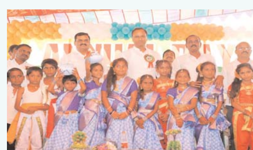
సాయం అందిస్తూనే ఉంటానని ఎమ్మెల్యే తెలిపారు. నాడు నిర్లక్ష్మం - నేడు ప్రగతి....

పాఠశాల వేడుకల వేదికగా గత ప్రభుత్వ వైఫల్యాలను ఎండగడుతూ, ప్రస్తుత ప్రభుత్వ అభివృద్ధి పనులను ఆయన వివరించారు. వైఎస్సార్ హయాంలో కోమటిరెడ్డి వెంకటరెడ్డి