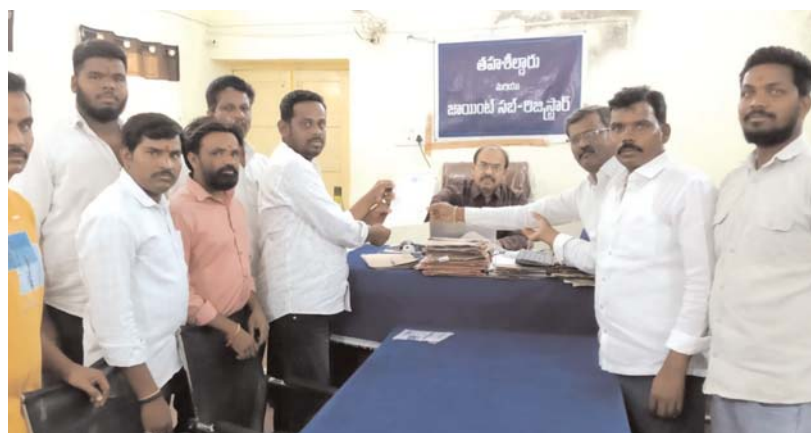
కొల్వారం, ఏప్రిల్ 09 (ఆక్షర కలం):-