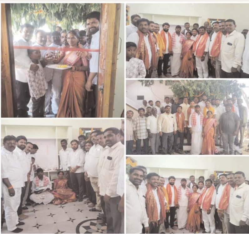
(ఆక్షర కలం, నారాయణపేట జిల్లా రిపోర్టర్, ఏప్రిల్,09)

- పేదోడి కలను సాకారం చేస్తున్న ముఖ్యమంత్రి రేవంతన్న సర్కార్ ;