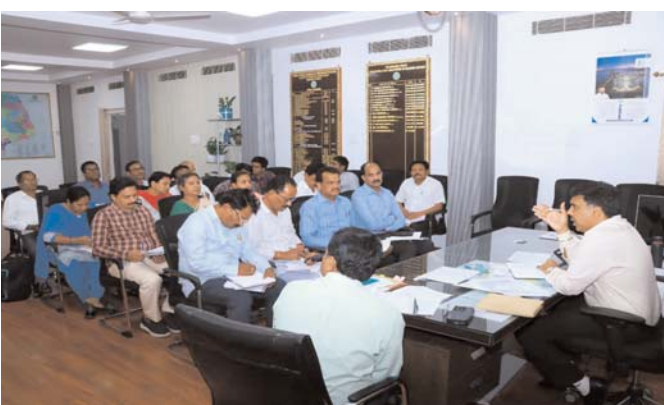
భూసేకరణ, పునరావాసం కల్పన, నష్ట పరిహారం చెల్లింపులలో

ఇరిగేషన్ ప్రాజెక్టుల నిర్మాణానికి కావాల్సిన భూసేకరణ పనులను వేగవంతం చేయాలని అధికారులను జిల్లా కలెక్టర్ బి. చంద్రశేఖర్ ఆదేశించారు. మంగళవారం కలెక్టర్ ఛాంబర్ లో ఇరిగేషన్, రెవెన్యూ, సర్వే అధికారులతో ప్రాజెక్టుల భూసేకరణ పై సమీక్షా సమావేశం నిర్వహించారు. ఉదయ సముద్రం, అయిబిపాముల లిఫ్ట్ ఇరిగేషన్, మాద ఎడవల్లి, శివస్మగూడెం, డిడి, నక్కలగండి, ఏకీబీయర్, పెండిపాకల, చింతలెట్టు తండా ప్రాజెక్టులకు సంబంధించిన భూసేకరణ పనులను త్వరగా పూర్తి చేస్తే వర్ష కాలం వచ్చే లోపు ప్రాజెక్ట్ పనులు వేగవంతం చేయవచ్చని రెవెన్యూ, ఇరిగేషన్, సర్వే అధికారులు సమన్వయము చేసుకుంటూ భూ సేకరణ పనులు త్వరగా పూర్తయ్యాలి చర్యలు తీసుకోవాలని కలెక్టర్ అన్నారు.