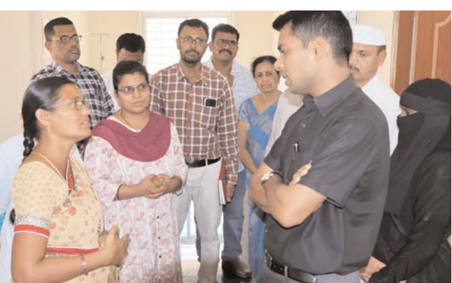
అక్షర కలం/ ఖమ్మం ప్రతినిధి: