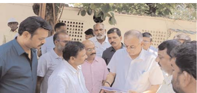
అక్షర కలం/ ఖమ్మం ప్రతినిధి: