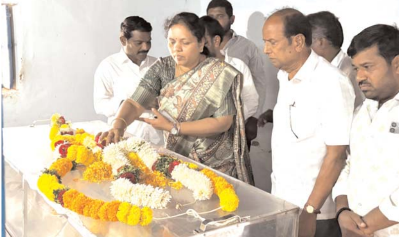
యాదాద్రి భువనగిరి అక్షర కలం