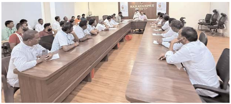
(అక్షర కలం, నారాయణపేట జిల్లా రిపోర్టర్, ఏప్రిల్, 07)