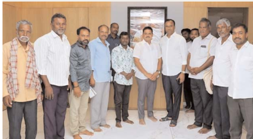
చౌటుప్పల్, (అక్షర కలం):