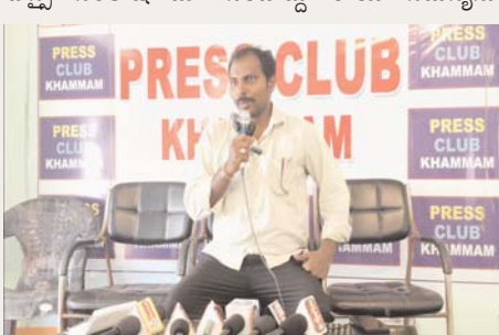
అక్షర కలం/ ఖమ్మం ప్రతినిధి: