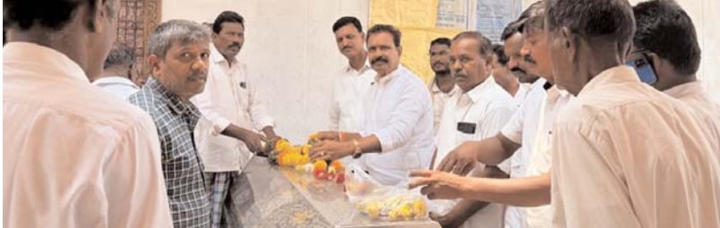
వలిగొండ అక్షర కలం