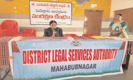
మహబూబ్ నగర్, ఏప్రిల్ 1 (అక్షరకలం):