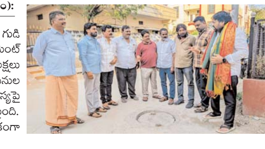
ఉప్పల్, ఏప్రిల్ 01(ఆక్షర కలం):

రాఘవేంద్ర నగర్ పోచమ్మ గుడి వీధిలో పెండింగ్లో ఉన్న సిమెంట్ రోడ్డు నిర్మాణానికి రూ.35 లక్షల మంజూరు కాగా, పనుల ప్రారంభంలో డ్రైనేజీ సమస్యపై స్థానికులు ఆందోళన వ్యక్తమైంది. దీంతో పనులు తాత్కాలికంగా నిలిచిపోయాయి.