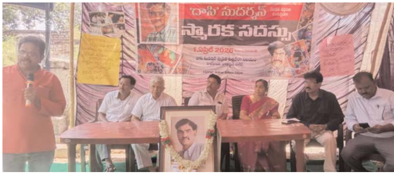
అక్షర కలం నాగార్జునసాగర్ / సందికొండ