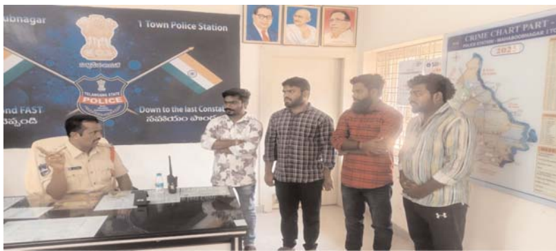
మహబూబ్ నగర్, ఏప్రిల్ 1 (అక్షరకలం):