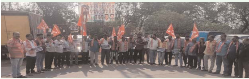
ఉప్పల్, ఏప్రిల్ 01, (అక్షర కలం):