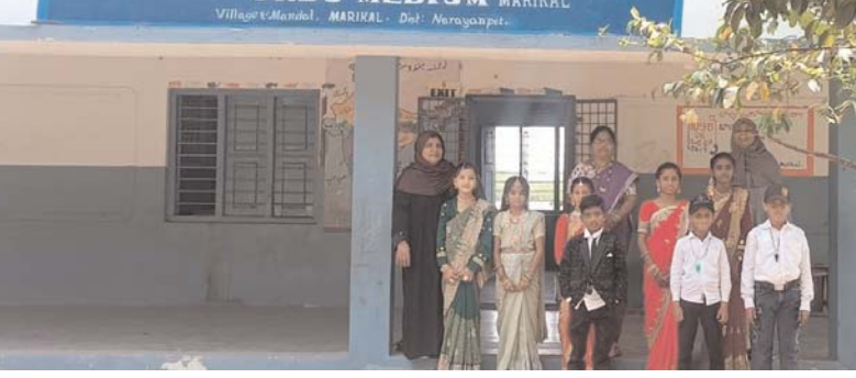
(ఆక్షర కలం, నారాయణపేట జిల్లా రిపోర్టర్, ఏప్రిల్,01)