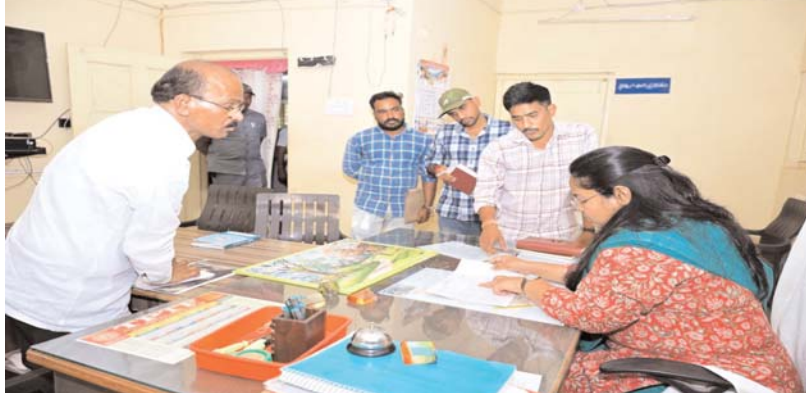
మెదక్/కొల్హారం ఏప్రిల్ 01(అక్షర కలం):-

పక్కపొంగి జనగణన మొదటి విడతలో చేపట్టే ఇండ్ల గణన బ్లాకుల రూపకల్పన పటిష్టంగా చేపట్టాలని జిల్లా కలెక్టర్ ప్రతిమాసింగ్ తాసిల్దార్లను ఆదేశించారు. బుధవారం టెక్నాలజీ మండల కేంద్రంలోని ఇండ్ల గణన ఏర్పాట్లను పరిశీలించారు. ఈ సందర్భంగా జిల్లా కలెక్టర్ ప్రతిమాసింగ్ మాట్లాడుతూ జన గణన మొదటి దశలో బాగాగా చేపట్టే ఇండ్ల గణన ప్రక్రియ వచ్చే నెల మే 11నుంచి జూన్ 09 వరకు నిర్వహించే ఇండ్ల గణనం ఎలాంటి పొరపాట్లకు తావు లేకుండా పక్కపొంగి నిర్వహించాలని జిల్లా కలెక్టర్ అధికారులను ఆదేశించారు. ఇండ్ల గణన జాబితా బ్లాక్ లను తయారు చేయడానికి మండలంలోని ఒక రెవెన్యూ గ్రామాన్ని యూనిట్ గా తీసుకుని గరిష్టంగా 300 ఇండ్లు లేదా 800 జనాభా ఉండేట్లు ఇండ్ల గణన బ్లాక్ లను ఏర్పాటుచేసి పోర్టల్ ద్వారా తయారు చేయాలన్నారు. ఎలాంటి తప్పిదాలు లేకుండా పటిష్టంగా జనగణన బ్లాకుల రూపకల్పన ప్రక్రియ సమర్థవంతంగా నిర్వహించాలన్నారు. సి ఎం ఎం ఎస్ పోర్టల్ నిర్వహణ చేసే ప్రక్రియ ఎలాంటి తప్పిదాలకు తావు లేకుండా చేసేందుకు తగు సూచనలు సలహాలు ఇచ్చారు. ఈ కార్యక్రమంలో స్థానిక తహశీల్దార్, ఎంపీడీవోలు, పాల్గొన్నారు.