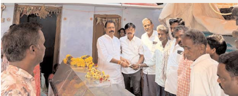
వలిగొండ అక్షర కలం