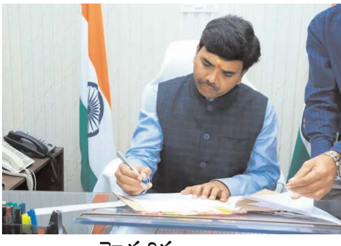
హెచ్చరిక ఉమ్మడి నల్లగొండ జ్యూర్ అక్షరకలం