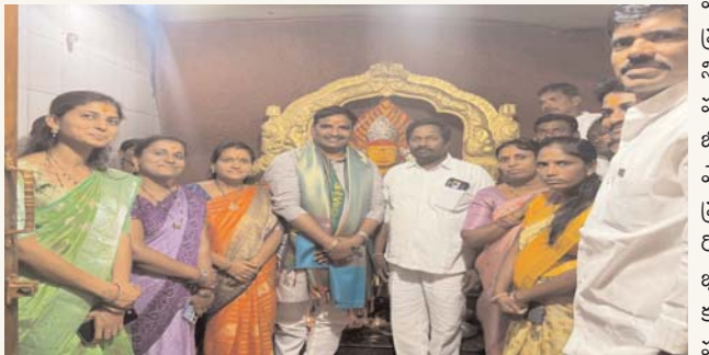
తెలంగాణ రాష్ట్ర ప్రభుత్వ ఐప్, ఆలేరు ఎమ్మెల్యే బీర్ల అయిలయ్య గురువారం యాదాద్రి భువనగిరి జిల్లాలోని యాదగిరిగుట్ట, టోమ్మలరామారం మండలాల్లో విస్తృతంగా పర్యటించారు. ప్రజల చెంతకు వెళ్తూ, అభివృద్ధి పనులను ప్రారంభిస్తూ ఆయన రోజంతా బిజీగా గడిపారు. సైదాపూర్లో అభివృద్ధి పనులు మరియూ జలకళ

తొలుత యాదగిరిగుట్ట మండలం సైదాపూర్ గ్రామానికి చేరుకున్న ఎమ్మెల్యేకు గ్రామస్థులు ఘనస్వాగతం పలికారు. గ్రామంలో మంజులైన ఇందిరమ్మ ఇల్లు లభించిన నినాసానికి స్వయంగా వెళ్లి ఎమ్మెల్యే, వారికి శుభాకాంక్షలు తెలిపారు. పేదల సొంతింటి కల నెరవేర్చడమే ప్రభుత్వ ధ్యేయమని ఈ సందర్భంగా ఆయన పేర్కొన్నారు. గ్రామంలో కొత్తగా నిర్మించనున్న సీసీ రోడ్డు పనులకు ఆయన శంకుస్థాపన చేశారు. భారీ వర్షాలకు సైదాపూర్ చెరువు నిండి అలుగు పారుతుండటంతో, ఎమ్మెల్యే జలవనరులకు ప్రత్యేక పూజలు నిర్వహించారు. నిండుకుండలా మారిన చెరువును చూసి హర్షం వ్యక్తం చేశారు. అనంతరం టోమ్మలరామారం మండల కేంద్రంలో ఎమ్మెల్యే పర్యటించారు. మండల కేంద్రంలోని ప్రసిద్ధ గట్టు మైసమ్మ తల్లి ఆలయం వద్ద సీసీ రోడ్డు నిర్మాణ పనులను కొద్దికొద్దిగా కొట్టి శుభారంభం చేశారు. భక్తులకు ఇబ్బందులు కలగకుండా మౌలిక వసతులు కల్పిస్తామని హామీ ఇచ్చారు. ఇక్కడ కూడా ఇందిరమ్మ ఇల్లు లభించిన ఇంటికి వెళ్లి, వారితో ముచ్చటించి శుభాకాంక్షలు తెలియజేశారు. ఈ పర్యటనలో స్థానిక ప్రజాప్రతినిధులు, మండల కాంగ్రెస్ నాయకులు, వివిధ విభాగాల అధికారులు పెద్ద సంఖ్యలో కార్యక్రమాలకు పాల్గొన్నారు.