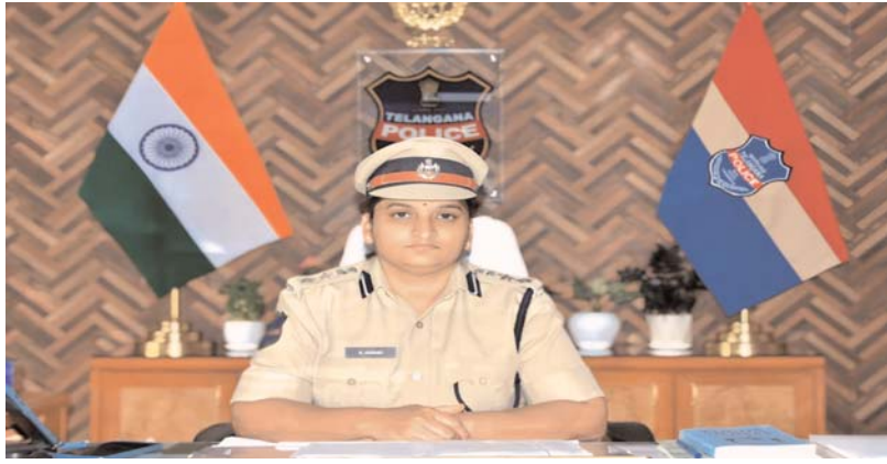
జరిమానా, పరిహారం చెల్లించాలని ఆదేశించడం ప్రాధాన్యత సంతరించుకుంది.

జిల్లాలో రెండు సంవత్సరాల క్రితం చోటుచేసుకున్న హత్యాయత్నం కేసులో న్యాయస్థానం కఠిన తీర్పు వెలువరించింది. నవాబ్ పేట్ పోలీస్ స్టేషన్ పరిధిలో నమోదైన ఈ కేసులో ముగ్గురు నిందితులకు ఒక్కొక్కరికి నాలుగు సంవత్సరాల కఠిన కారాగార శిక్ష విధించడంతో పాటు