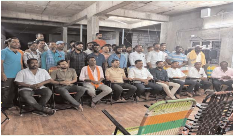
(అక్షర కలం, నారాయణపేట జిల్లా రిపోర్టర్, మార్చి 26)