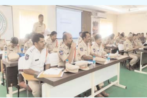
జిల్లా పోలీసు ప్రధాన కార్యాలయం కాన్ఫరెన్స్ హాల్లో