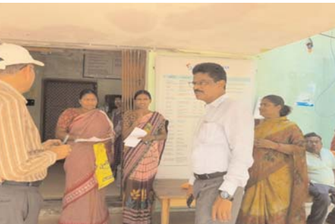
చేయాలని జిల్లా అదనపు కలెక్టర్ (స్థానిక సంస్థలు) పి