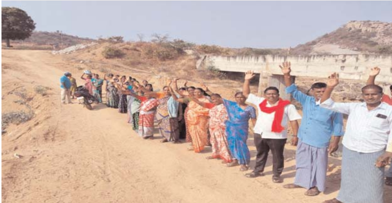
యాదాద్రి ఘనగిరి అక్షర కలం

--ప్రజలకు అనుకూలంగా బ్రిడ్జి నిర్మాణం చేపట్టాలి