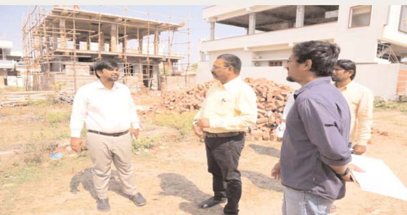
మండపల్లి, మార్చి 26 అక్షర కలం ప్రతినిధి: