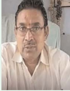
అక్షర కలం, నారాయణపేట, జిల్లా రిపోర్టర్, (మార్చి 26)