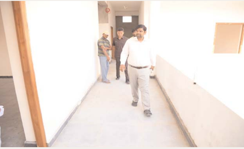
అక్షర కలం, మంచెర్యాల జిల్లా ప్రతినిధి, మార్చి 26:

బాలనందనం భవన నిర్మాణ పనులను వేగవంతం చేయాలని జిల్లా కలెక్టర్ కుమార్ దీపక్ తెలిపారు. గురువారం జిల్లాలోని సస్యార్ మండల కేంద్రంలో చేపట్టిన బాలనందనం భవన నిర్మాణ పనులను పరిశీలించారు. ఈ సందర్భంగా జిల్లా కలెక్టర్ కుమార్ దీపక్ మాట్లాడుతూ, పంచాయతీరాజ్ ఇంజనీరింగ్ విభాగం ఆధ్వర్యంలో 1 కోటి 34 లక్షల రూపాయల మిషన్ వాళ్ళు అంచనా నిధులతో బాలనందనం భవన నిర్మాణ పనులు చేపట్టడం జరిగిందని, పనులు త్వరగా పూర్తిచేసేలా అధికారులు పర్యవేక్షించాలని తెలిపారు. ఈ కార్యక్రమంలో సంబంధిత అధికారులు తదితరులు పాల్గొన్నారు.