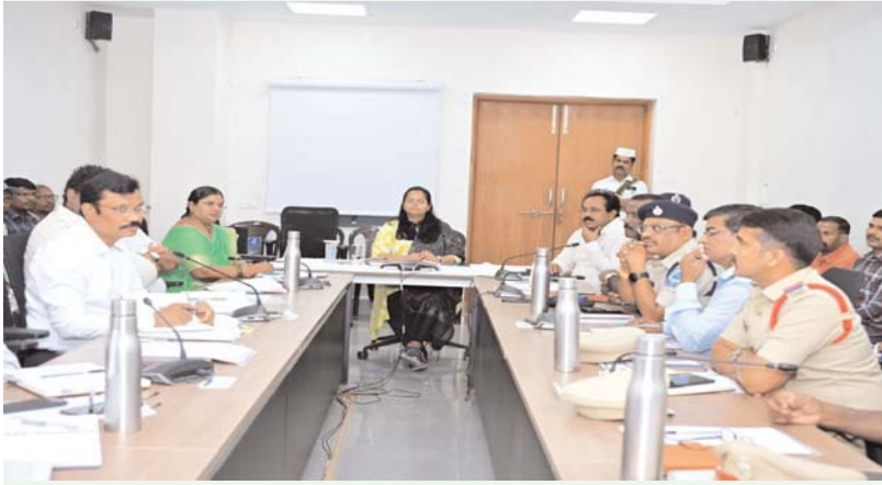
మెడక్ /కొల్హారం మార్చి 26(అక్షర కలం):-

జిల్లా స్టాయి సాండి కమిటీ సమావేశంలో జిల్లాలో ఇసుక అక్రమ తవ్వకాలు, రవాణా నియంత్రణకు పట్టి చర్యలు తీసుకోవాలని జిల్లా కలెక్టర్ ప్రతిమా సింగ్ ఆదేశించారు. జిల్లాలో అక్రమంగా ఇసుక రవాణా చేసే కఠిన చర్యలు తప్పవని కలెక్టర్ హెచ్చరించారు. గురువారం మెడక్ కలెక్టర్లలో నిర్వహించిన జిల్లా స్టాయి సాండి కమిటీ సమావేశంలో అదనపు కలెక్టర్ నగేష్, అదనపు ఎస్పీ మహేందర్, ఆర్.వి.ఎ. తానిల్లార్లు, మైనింగ్, ఇరిగేషన్, పంచాయతీ వాసింగ్ అధికారులతో కలిసి తో కలిసి పాల్గొని మాట్లాడారు. జిల్లాలో ఏప్రిల్ 1 నుండి 100% ఇసుక సరఫరా "మన ఇసుక వాహనం" ద్వారా ఆన్లైన్ విధానంలోనే నిర్వహించాలని స్పష్టం చేశారు. ఇసుక రవాణా పూర్తిగా ప్రభుత్వ నిబంధనలకు అనుగుణంగా జరగాలని అధికారులను ఆదేశించారు. ఇసుక అక్రమంగా ఇసుక రవాణా చేసే వాహనాలు పట్టుబడితే బైందోవర్ కేసులు నమోదు చేసి జరిమానా విధించాలని ఆదేశించారు. ప్రతి ఇందిరమ్మ ఇళ్ల లభిదారులకు సకాలంలో ఇసుక అందించేందుకు ఆన్లైన్ సమయం చేయించాలన్నారు. పోలీస్, రెవెన్యూ, మైనింగ్ అధ్యక్షులలో జిల్లా స్టాయిలో ఒక మొబైల్ టీం ఏర్పాటు చేసి అక్రమంగా ఇసుక రవాణాను అడ్డుకోవాలన్నారు. తహసీల్దార్లు వారానికి కనీసం రెండు సార్లు రీవ్యూ సందర్భించాలని తెలిపారు. ఈ కార్యక్రమంలో అధికారులు సిబ్బంది పాల్గొన్నారు.