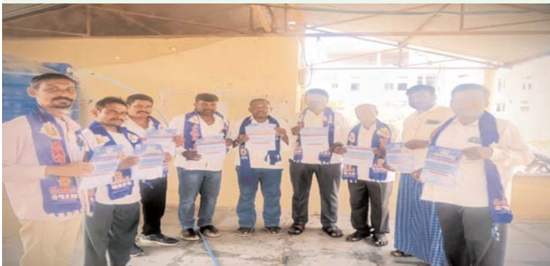
ఆత్మకూరు (ఎం) అక్షర కలం