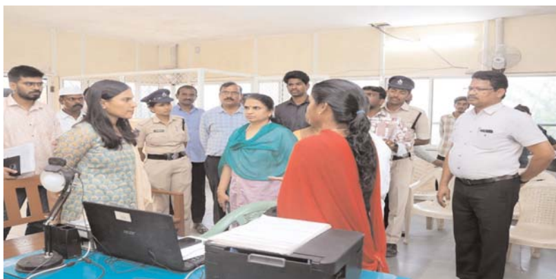
సంగారెడ్డి ప్రతినిధి, అక్షరకలం..