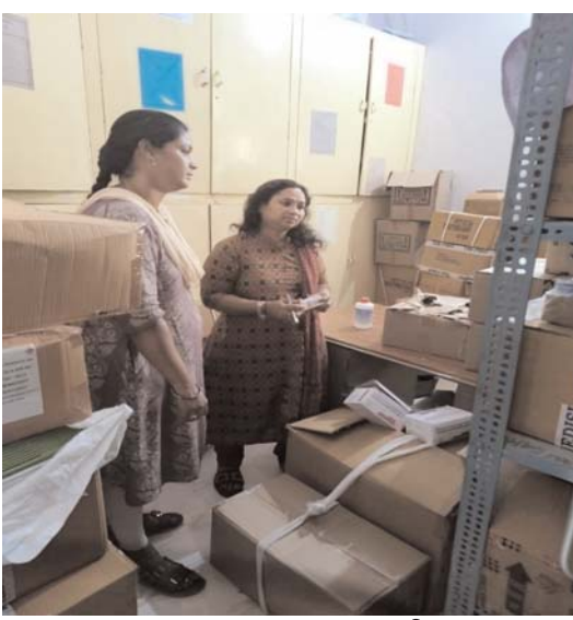
ఆసుపత్రి, ఎంపీడీవో కార్యాలయాల పరిశీలన