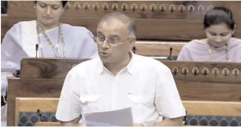
ఆక్షర కలం/ ఖమ్మం ప్రతినిధి:

దేశంలో 15 ఎస్ఈజెడ్లు..అందులో రెండు తెలంగాణలోనే