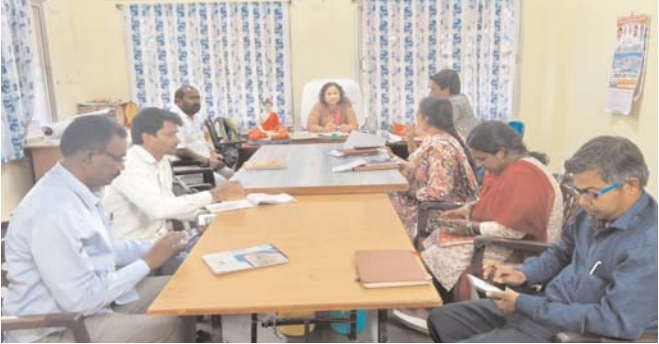
రికార్డులు పక్కాగా ఉండాలి అధికారులకు జెడ్పీ సీఈఓ శోభారాణి ఆదేశం ఉపాధి హామీ పనులపై సమీక్ష