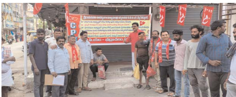
అక్షర కలం / భద్రాచలం