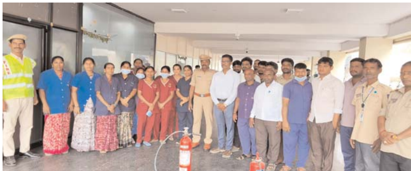
సంగారెడ్డి ప్రతినిధి, అక్షరకలం..