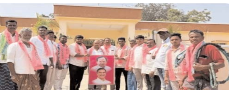
అక్షర కలం సిద్దిపేట మార్చి 24: